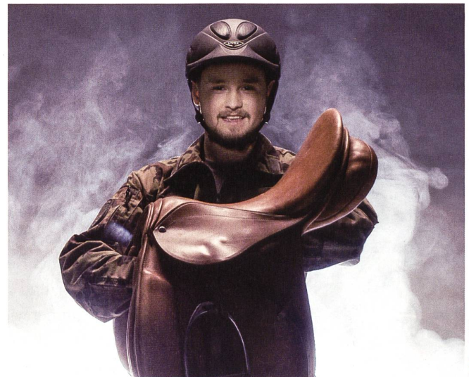
SAT stellt auch Pferde zur Verfügung.