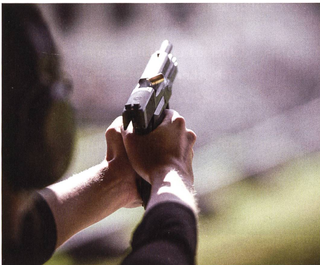
SAT führt über 2500 Schiessvereine.

Diese Aufgabe umfasst insbesondere die Abwicklung der administrativen Aufgaben im Zusammenhang mit den obligatorischen und freiwilligen Schiessübungen mit Ordonnanzwaffen und Ordonnanzmunition durch die anerkannten Schiessvereine. Auch die Durchführung von ausserdienstlichen Ausbildungs- und Wiederholungskursen im Schiesswesen (Jungschützenleiter und Schützenmeister) wird durch das SaD abgedeckt. Besondere Bedeutung hat die Gewährleistung der Sicherheit der Schiessanlagen für Ordonnanzwaffen. Mit dem Eidgenössischen