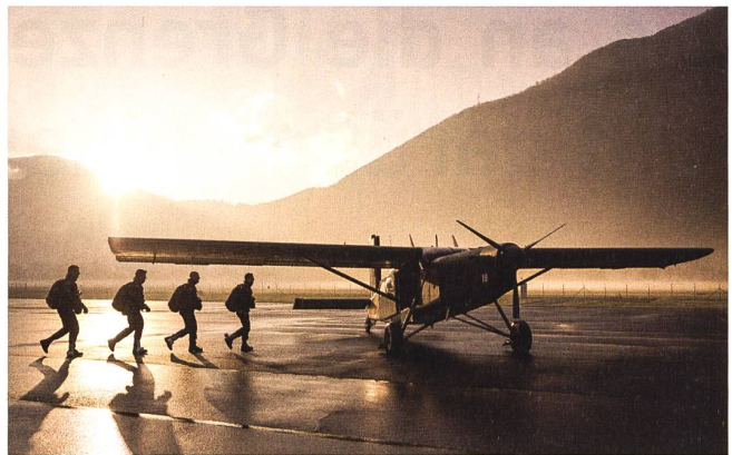
Bei «SPHAIR» geschieht die fliegerische Vorschulung.

Schiessanlagenexperten (ESAE), welcher dem Ausbildungszentrum der Armee (AZA) unterstellt ist, steht ein Fachmann als Berater des VBS und der Eidgenössischen Schiessoffiziere (ESO) für alle technischen Belange der Schiessanlagen im SaD zur Verfügung.