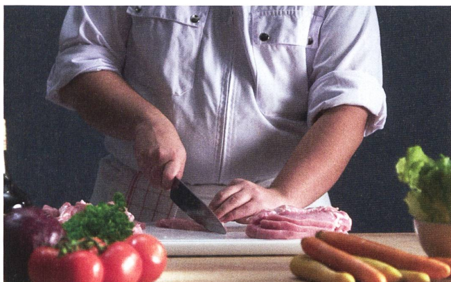
Kochen als ausserdienstliche Tätigkeit.

Schiessanlagenexperten (ESAE), welcher dem Ausbildungszentrum der Armee (AZA) unterstellt ist, steht ein Fachmann als Berater des VBS und der Eidgenössischen Schiessoffiziere (ESO) für alle technischen Belange der Schiessanlagen im SaD zur Verfügung.