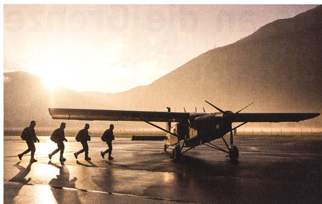
Bei «SPHAIR» geschieht die fliegerische Vorschulung.