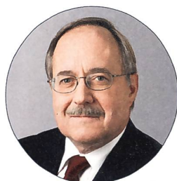
alt Bundesrat Samuel Schmid