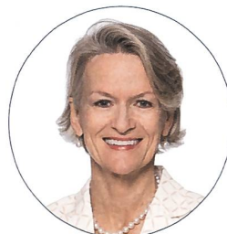
Ständerätin Andrea Gmür- Schönenberger