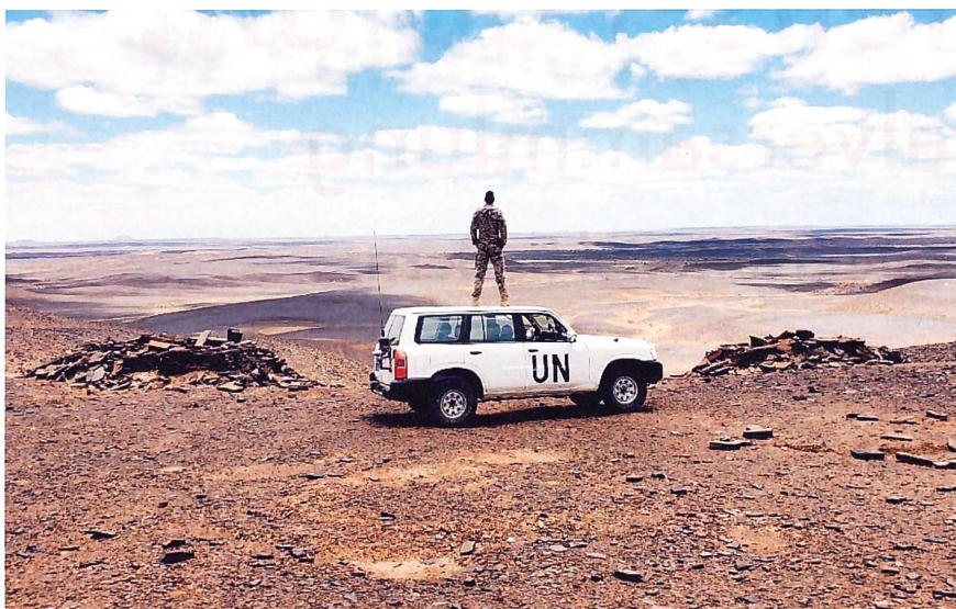
Wirkung vor Deckung gilt auch für Militärbeobachter.