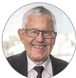
alt Bundesrat Kaspar Villiger