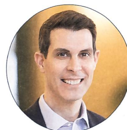
Ständerat Thierry Burkart

Die Platzzahl zum Anlass ist beschränkt.