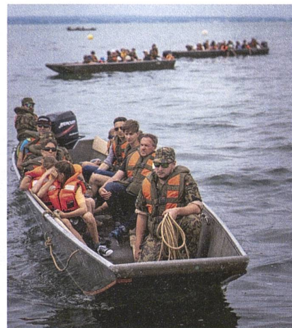
Evakuations von Zivilpersonen mit Übersetzbooten.