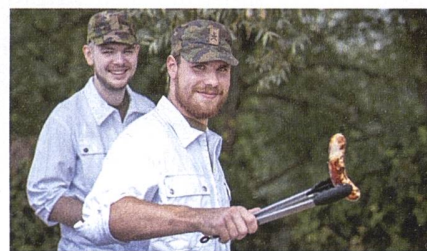
Der Küchenchef sorgt für das leibliche Wohl der Gäste.