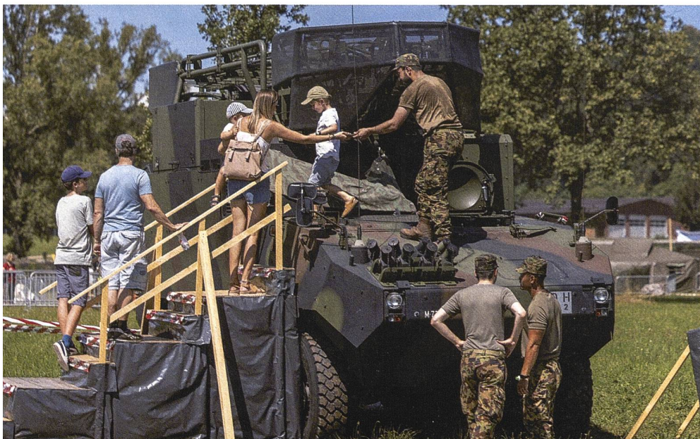
Gelebte Miliz vom Feinsten: Soldaten zeigen den Besuchern ihr Fahrzeug.

Wieder zurück in der konventionellen militärischen Welt, war auch die Ausstellung des Lehrverbandes Panzer/Artillerie und der Militärpolizei durchaus geeignet, Staunen hervorzurufen. Ein Sicherheitstransport bei der Militärpolizei als Display auf-