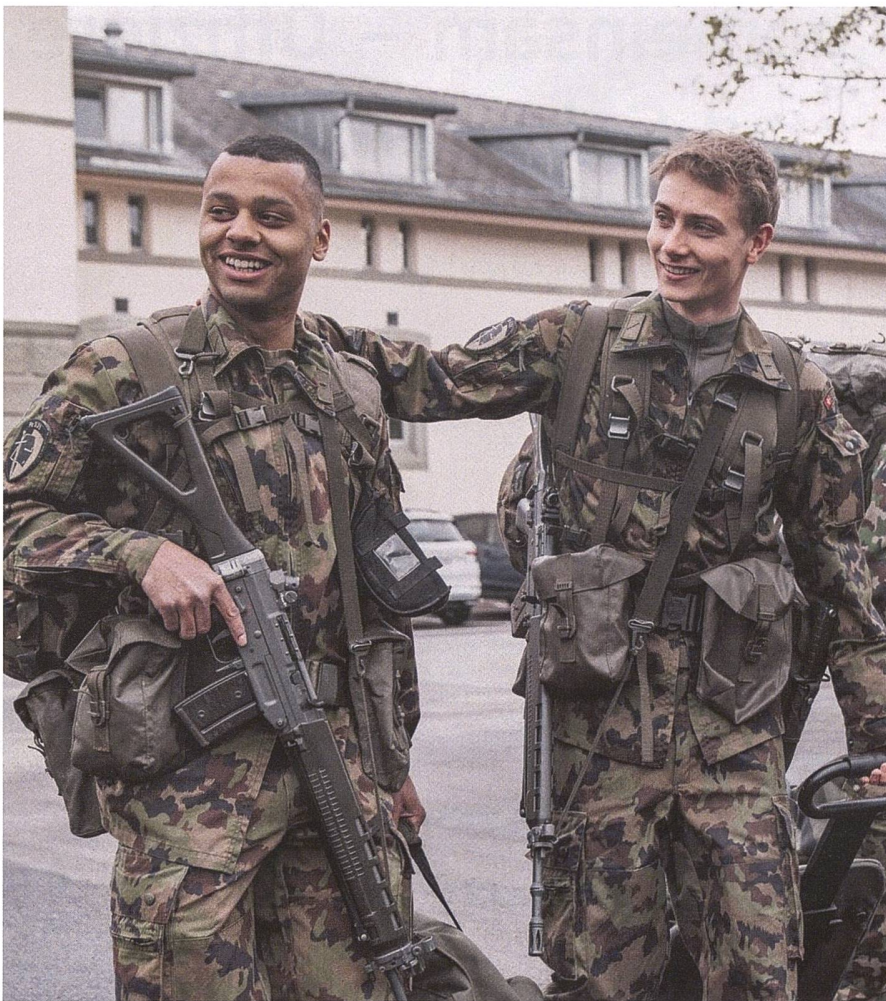
In der Armee ist man nie allein.

schen führen, wenn ich nicht mit einem schweren Ereignis in meinem eigenen Leben umgehen kann?» Schweigen. Eine Frage hängt in der Luft: Wie viel Mensch darf in einem militärischen Chef stecken?