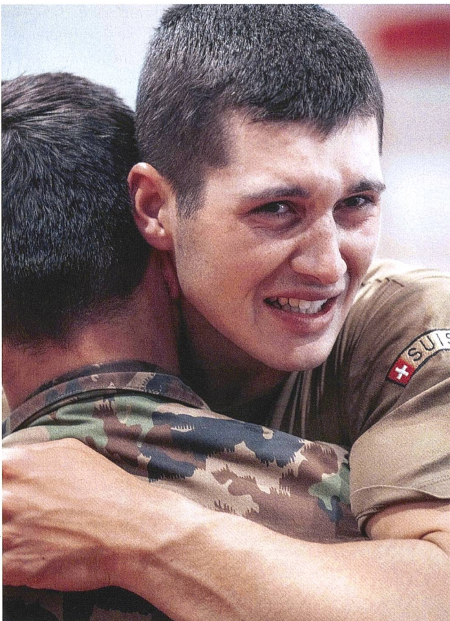
Führen bedeutet nicht, seine Menschlichkeit zu vergessen, sondern diese anzuerkennen und anzunehmen.

Eine von Schmerz verzerrte Stimme. «Was soll ich denn tun? Wie soll ich Men-