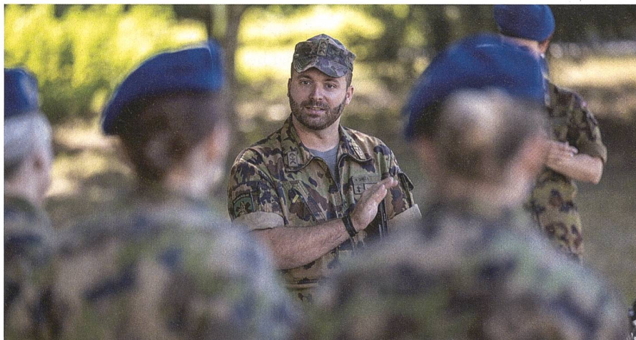
Berufsunteroffiziere befähigen die Miliz, die Soldaten selbst auszubilden (Symbolbild).

Der Weg zum Berufsunteroffizier (BU) in der Schweizer Armee beinhaltet mehrere Schritte. Zunächst muss man in der Miliz den Rang eines höheren Unteroffiziers erreichen. Danach bewirbt man sich bei der Armee und wird zur Selektion 1 zugelassen, wo die Eignung für den Berufsunteroffiziersposten geprüft wird. Bei Erfolg erhält man einen befristeten Arbeitsvertrag als Berufsunteroffizierskandidat und wird in der Rekrutenschule eingesetzt. Gleichzeitig bereitet man sich auf die Selektion 2 vor, die den Zugang zur Berufsunteroffiziersschule (BUSA) ermöglicht. Nach erfolgreichem Abschluss dieser Schule wird man zum Berufsunteroffizier befördert und in eine Funktion eingeteilt.