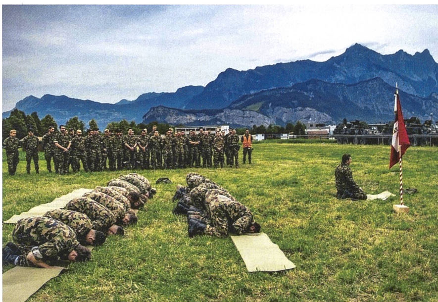
Die Schweizer Soldaten beten in Richtung Mekka.