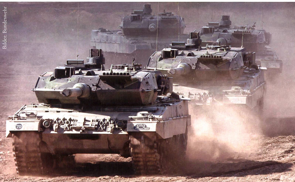
Die Bundeswehr soll frühestens ab 2025 neue Kampfpanzer erhalten.