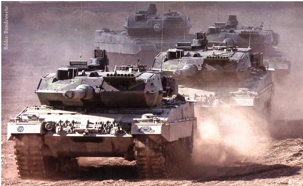
Die Bundeswehr soll frühestens ab 2025 neue Kampfpanzer erhalten.