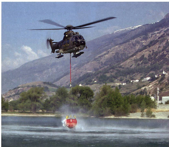
Museumstag vom Samstag, 1. Juli 2023: Im Zentrum steht das Thema «Die Armee hilft».