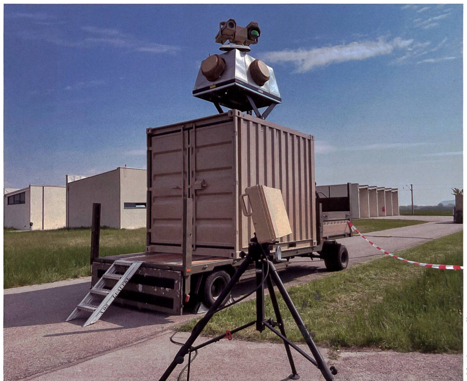
Rheinmetall liefert das Counter-sUAS-Anti-Drohnen-System zur Evaluierung an das Österreichische Bundesheer.