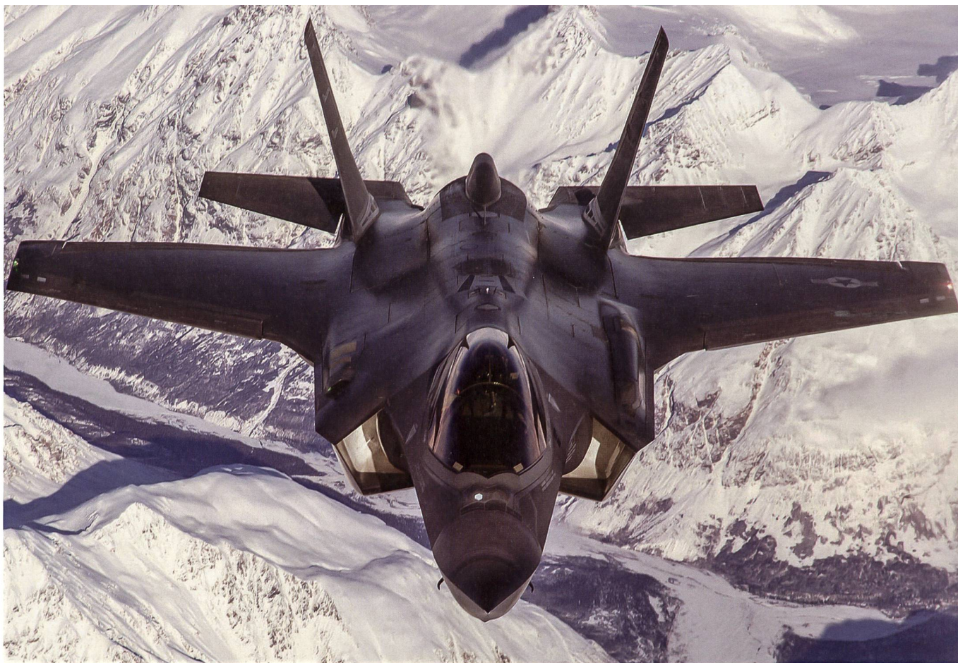
Deutschland will ebenfalls F-35 Kampffjets beschaffen. Die Bundesregierung wurde in das Programm aufgenommen.