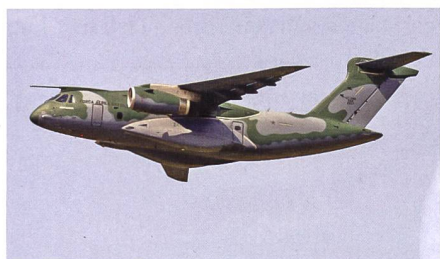
Taktisches Transportflugzeug Embraer C-390 Millennium.

Embraer und Saab arbeiten bereits beim Gripen-Programm eng zusammen; nun haben die beiden Luftfahrt- und Rüstungskonzerne eine Absichtserklärung bekannt gegeben, dass sie neben dem Gripen auch beim C-390-Millennium-Militärtransporter