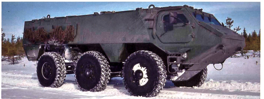
Finnland beschafft Radschützenpanzer der CAVS-Familie.