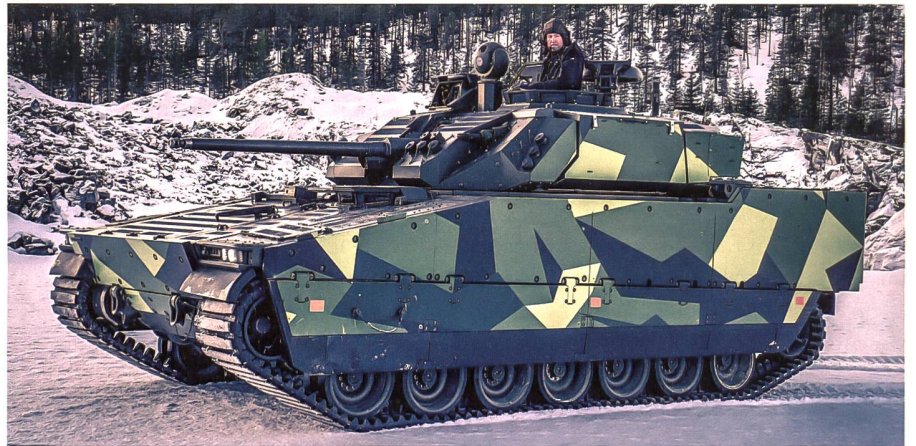
CV90 MkIV für die tschechischen Streitkräfte.

Die Tschechische Republik hat die Verhandlungen mit der schwedischen Regierung, der schwedischen Verteidigungsbeschaffungsorganisation FMV und BAE Systems Hägglunds über den Kauf von 246 Schützenpanzern CV90 MkIV in sieben verschiedenen Varianten erfolgreich abge-