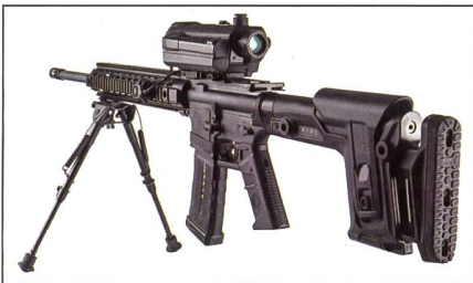
SMASH X4 von Smart Shooter zur infanteristischen Drohnenabwehr.

Die Bundeswehr investiert in die infanteristische Drohnenabwehrfähigkeit und beschafft dafür SMASH-Feuerleitvisiere für das G27P. So hat das Bundesamt für Ausrüstung, Informationstechnik und Nutzung der Bundeswehr (BAAINBw) die Beschaffung von «Zielassistenzsystemen zur Detektion und kinetischen Abwehr von Class 1 UAS» beschlossen. Mit Class 1 UAS sind unbemannte Flugsysteme (Drohnen) unterhalb der Gewichtsklasse von 150 kg gemeint. Die Bundeswehr hat die SMASH-Systeme bereits vor geraumer