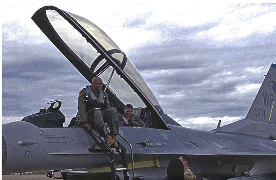
Brown war F-16-Kampfpilot und weist über 3000 Flugstunden auf, davon deren 130 in Kampfeinsätzen, u.a. in der Operation «Southern Watch» im Irak.