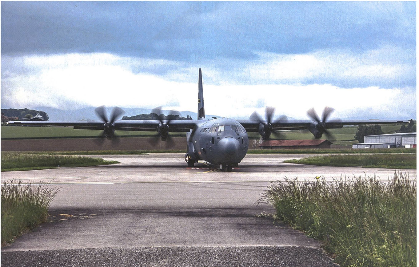
Ein Flugzeug der US Air Force transportierte die Lenkwaffen nach Payerne.