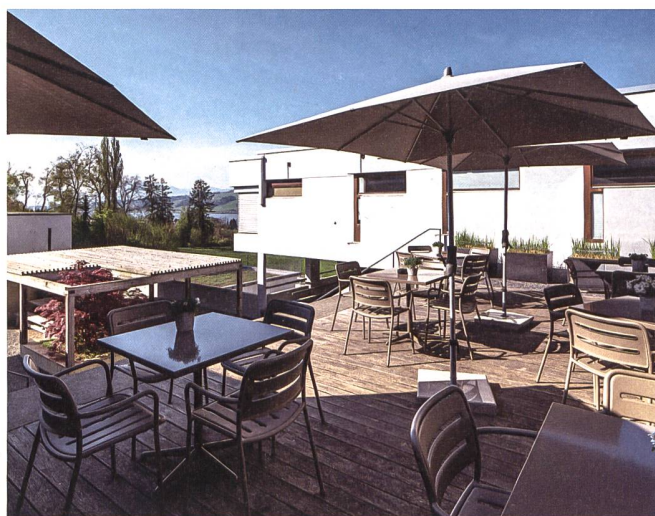
Neben Polizeischule und Seminarräumen dient der Standort auch als Ort für private Anlässe wie Hochzeiten oder Geburtstage.