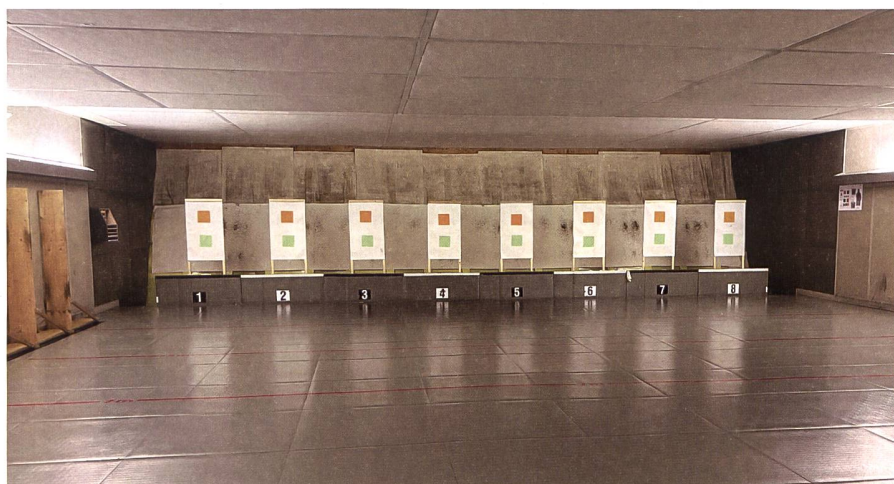
In einem der vier Schiesskeller werden die Aspirantinnen und Aspiranten während 86 Schiesslektionen an der Waffe ausgebildet.