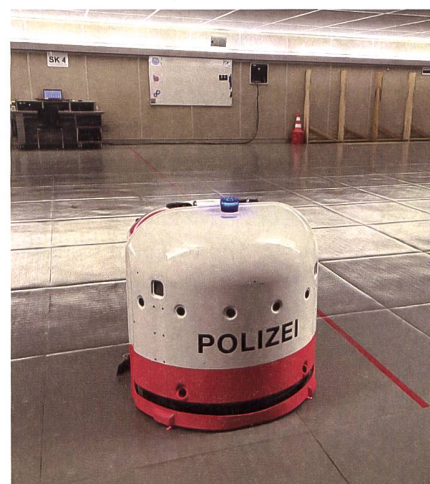
Die Reinigung der Schiesskeller übernimmt ein etwas anderer Polizist.