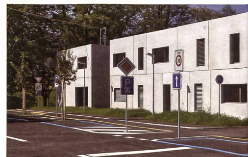
Das Trainingscenter Aabach kann von Seminar