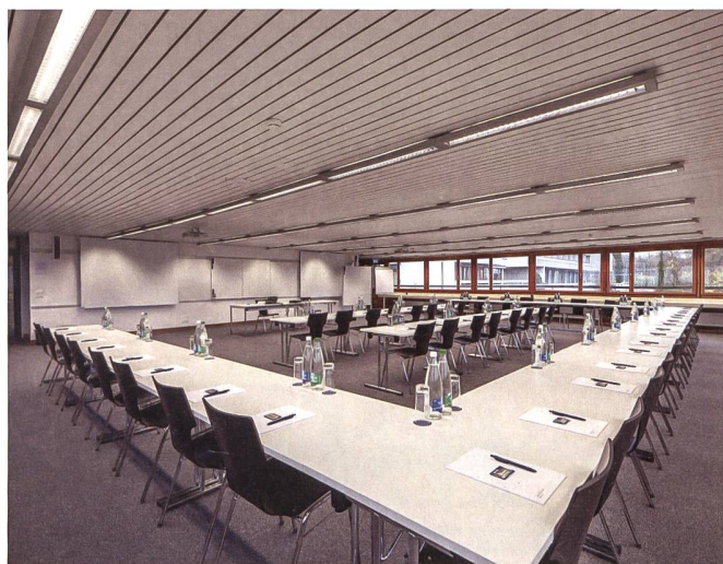
Das Seminarzentrum Hitzkirch verfügt über 28 verschiedene Seminarräume.