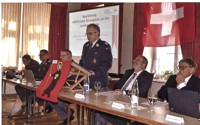
Dieses Jahr durften gleich sechs neue Mitglieder begrüsst werden.