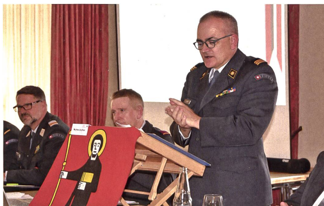
«Bei der Armee gibt es immer einen Kampf um das Budget.»