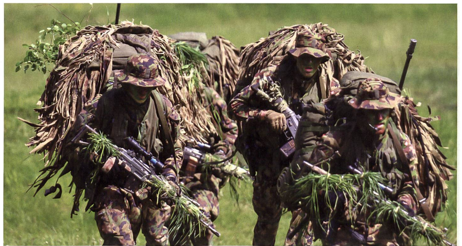
Die Späher müssen ausserordentlich fit sein – denn das Scharfschützengewehr und die gesamte Ausrüstung wird immer auf dem Rücken getragen!