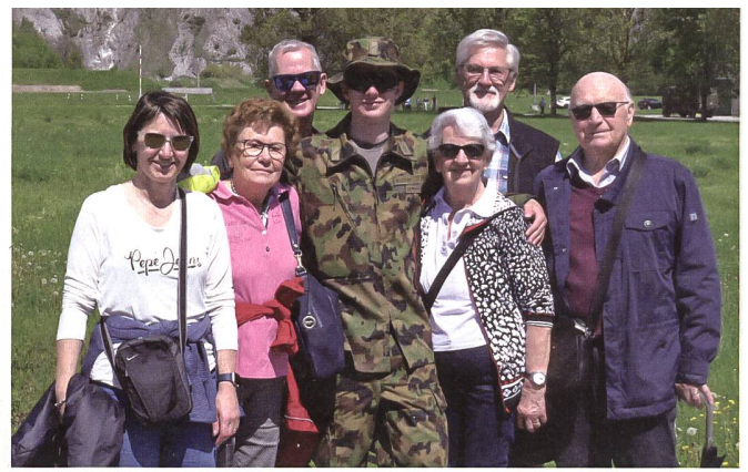
Wie der Grossvater, so der Enkel: Der Grosspapi von Soldat Steich absolvierte seine RS ebenfalls in Chur und ist sichtlich stolz.

formance der Soldaten, sondern wegen zweier besonderer Überraschungen. «Wir haben gestern sogar sieben Stunden am Stück geübt», sagt ein Soldat gegenüber dem SCHWEIZER SOLDAT. Und es hat sich gelohnt.