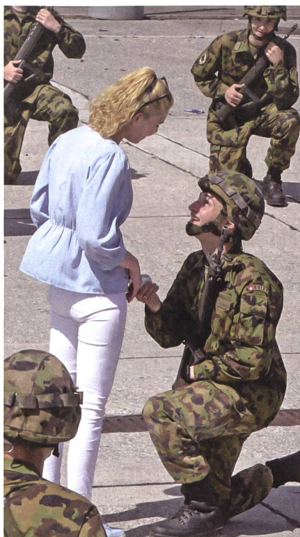
Ein Heiratsantrag der besonderen Art.