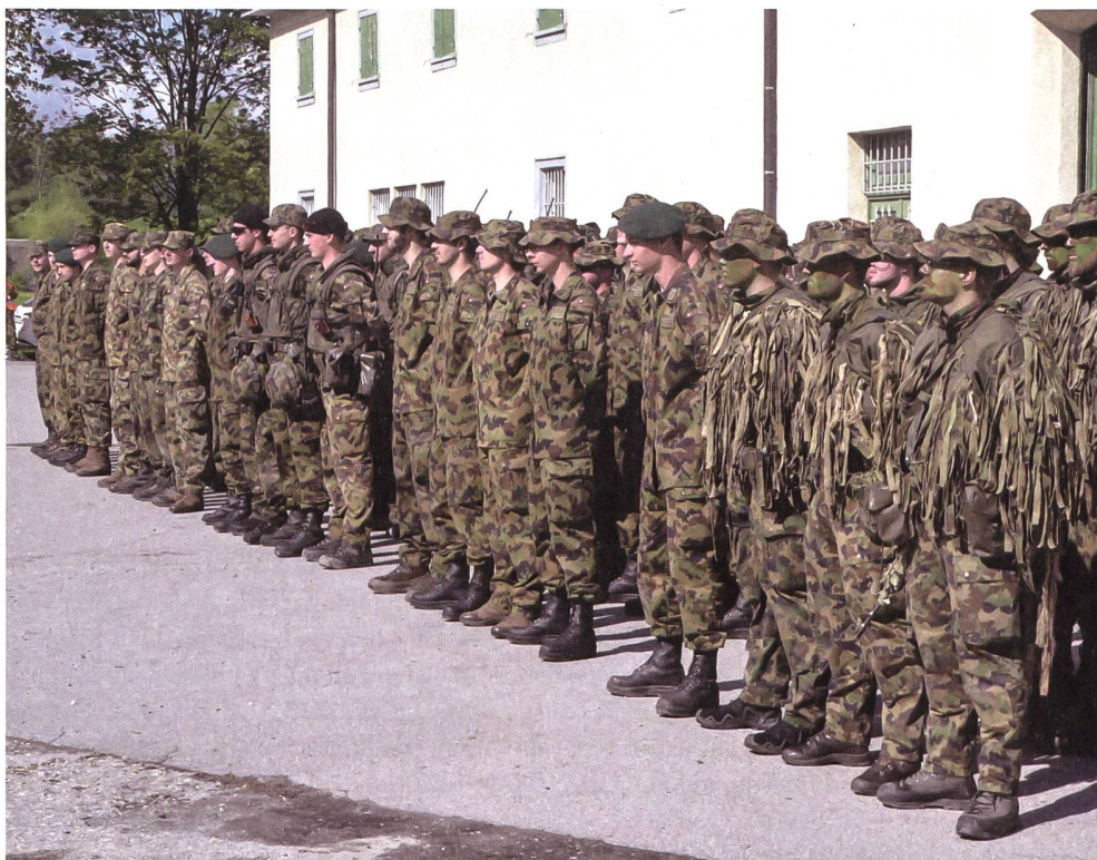
Die Unterstützungskompanie präsentiert sich stolz vor den Angehörigen.