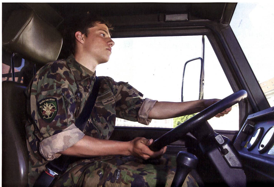
Je nach Region können sich pro Jahr zwischen 100 und 200 interessierte Jugendliche einschreiben.

Im Regionalkurs kommen die Jungmotorfahrer und Jungmotorfahrerinnen zum ersten Mal mit Militärfahrzeugen in Berührung. Auf leichten Geländefahrzeugen wird den Jugendlichen primär technisches Wissen und Manövrieren vermittelt. Im Theorieteil wird Wissen über den militärischen Strassenverkehr, die zivilen Fahr-