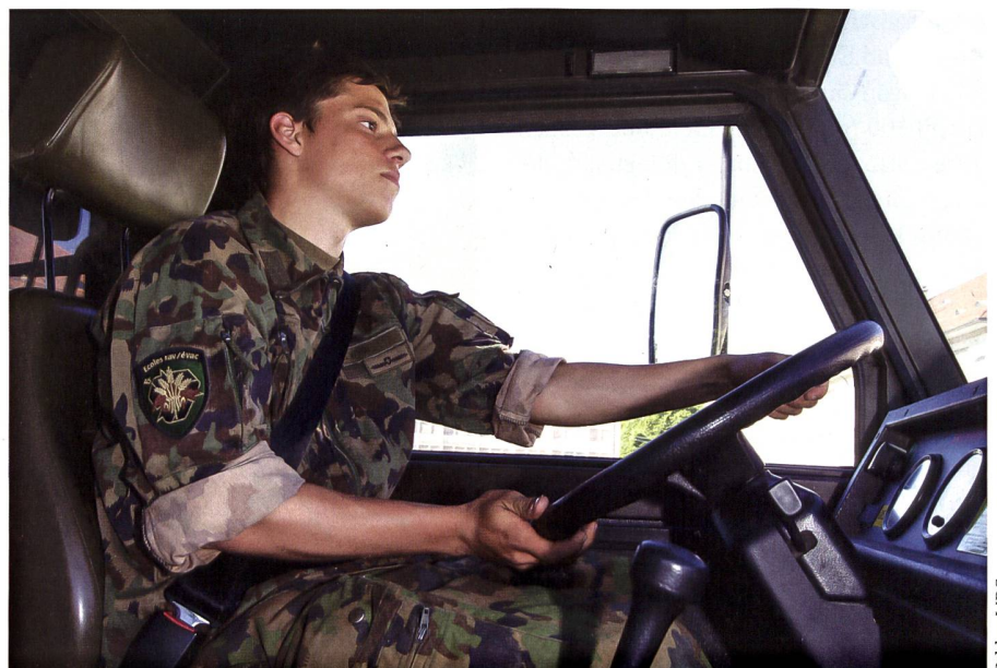
Je nach Region können sich pro Jahr zwischen 100 und 200 interessierte Jugendliche einschreiben.

Im Regionalkurs kommen die Jungmotorfahrer und Jungmotorfahrerinnen zum ersten Mal mit Militärfahrzeugen in Berührung. Auf leichten Geländefahrzeugen wird den Jugendlichen primär technisches Wissen und Manövrieren vermittelt. Im Theorieteil wird Wissen über den militärischen Strassenverkehr, die zivilen Fahr-