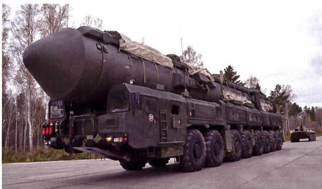
Die EU nennt explizit Russland und China als Bedrohungen und erwähnt die Drohungen des Einsatzes nuklearer Waffen des Systems Putin.