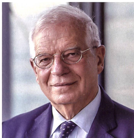
Europa müsse liefern, fordert Josep Borrell, der Hohe Vertreter der EU für Aussen- und Sicherheitspolitik.