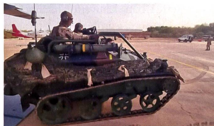
Deutsche Fallschirmjäger mit dem Waffenträger Wiesel sicherten den Flughafen.

Wie der Schweizer Botschafter Christian Wanner nach seiner Rückkehr aus dem Sudan an einer Pressekonferenz auf dem Flugplatz Bern-Belp sagte, erlebte die Schweizer Delegation dramatische Tage und Stunden. Sie waren in ihrer sicheren Unterkunft gefangen, die Evakuation