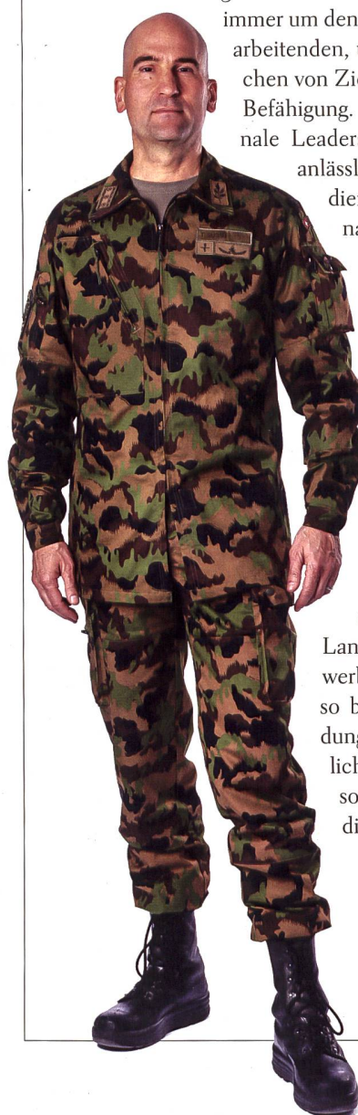
Korpskommandant Thomas Süssli Chef der Armee

Die Erfolgsstory Schweiz ist auch eine Geschichte der Sicherheit unseres Landes. Dazu trägt die wettbewerbsfähige Wirtschaft genauso bei wie die innovative Bildungslandschaft und die Blaulichtorganisationen. Damit das so bleibt, bildet die Armee die Leader von morgen aus.