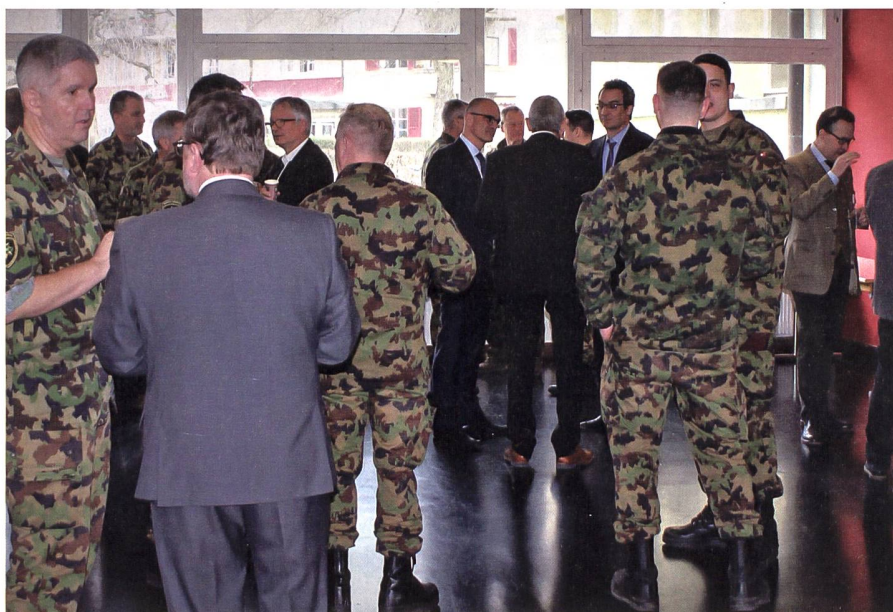
Die Teilnehmenden nutzten in der Pause die Gelegenheit, um das Netzwerk zu pflegen und weiter auszubauen.