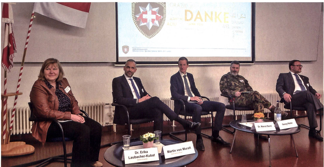
Einigkeit auf dem Podium: In Krisen muss man seine Partner kennen.

«Wir richten unser Tun auf die Stärkung und Weiterentwicklung des Gesamtsystems Armee aus.»