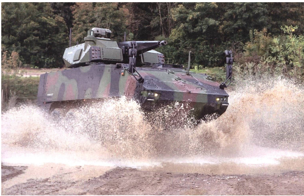
Die Rheinmetall Air Defence AG in Zürich finalisiert im Moment die Mobile Plattform Skyranger hier auf einem GDELS Piranha mit einer 30mm×173 KCE Revolverkanone.

6000-8000 Meter. Selbst die neu aufkommenden dezidierte Anti-UAV Lenkwaffen werden bis zu 500 Meter brauchen, um wirken zu können.