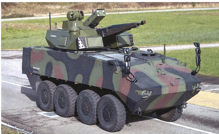
Eine Rückbesinnung auf autonome mobile Flabsysteme, welche alle Fertigkeiten der Flugabwehr auf einer Plattform vereinen, wurde eingeläutet.

Die aktuellen Lenkwaffen haben eine minimale Einsatzdistanz von 800-1200 Meter bei einer effektiven Reichweite von