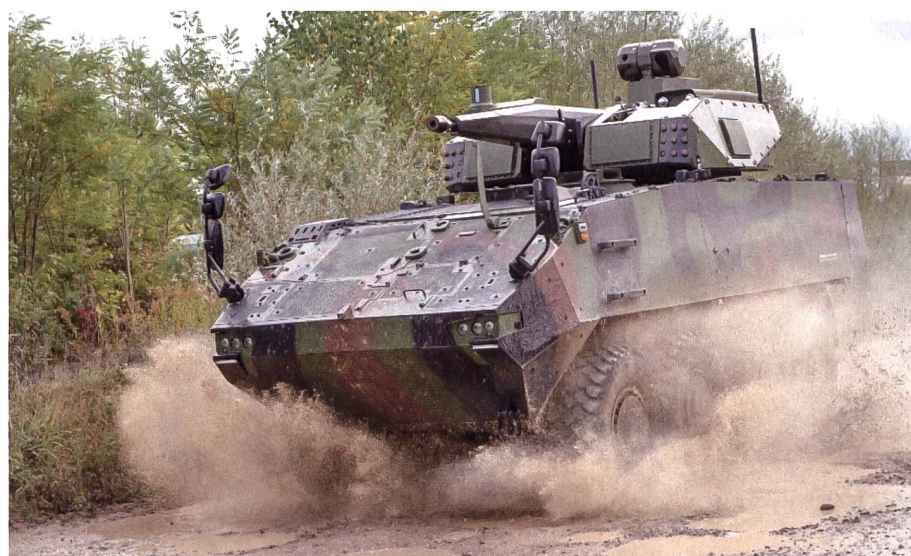
Zusammenfassend kann gesagt werden, dass Flugabwehr eine Fertigkeit ist und die mobile Applikation die Kür.