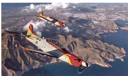
Zusätzliche PC-21 für die Spanien.

Die spanische Luftwaffe kauft weitere 16 PC-21 und dazugehörige Simulatoren und wird damit zum grössten PC-21 Betreiber in Europa. Anfangs 2020 haben sich die spanischen Luftstreitkräfte, die Ejército del Aire, entschieden, 24 PC-21 zu kaufen. Der letzte PC-21 dieses Auftrags wurde Mitte 2022 an Spanien ausgeliefert.