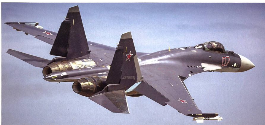
Kampfflugzeug Su-35 für den Iran.

Irans Luftstreitkräfte sind hoffnungslos veraltet, so ist es nicht verwunderlich, dass sich der Iran für modernste russische Kampfflugzeuge interessiert. Laut der iranischen Nachrichtenagentur IRNA hat sich Russland bereit erklärt, modernste Sukhoi Su-35 an den Iran zu liefern. In Fachkreisen spricht man von bis zu 50 Sukhoi Su-35, die Russland in Zukunft an den Iran liefern könnte. Wann die ersten vierundzwanzig Su-35 in den Iran geliefert werden, ist noch unklar. Der Iran verfügt neben russischen und wenig chinesischen Kampfflugzeugen derzeit auch noch über viele US-amerikanische Kampffjets, die vor der Islamischen Revolution von 1979 an den Iran ausgehändigt wurden. Darunter befinden sich noch 63 McDonnell Douglas F-4 Phantom aller Versionen, 35 Northrop 5-E Tiger II und 41 Grumman F-14