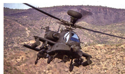
Grossauftrag für Boeing zur Herstellung von AH-64E Apaches.