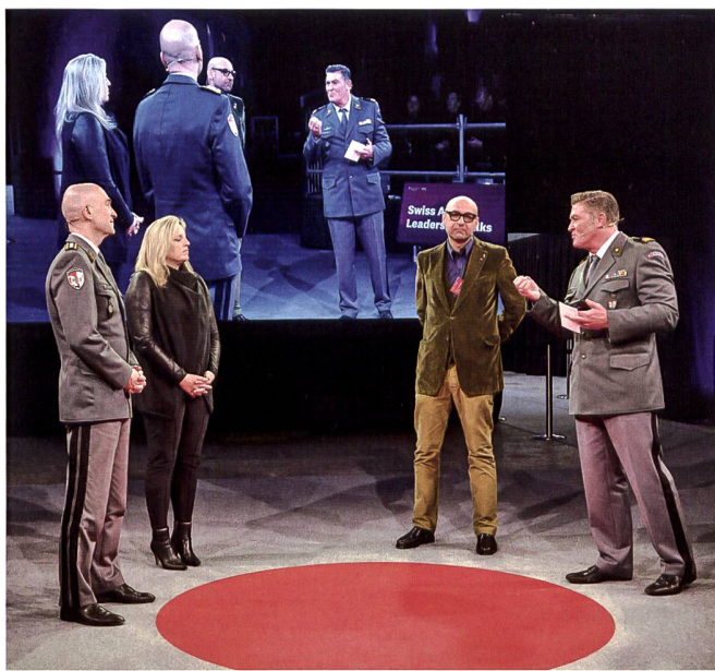
Im Anschluss an die Vorträge hatte das Publikum die Möglichkeit, Fragen zu stellen.