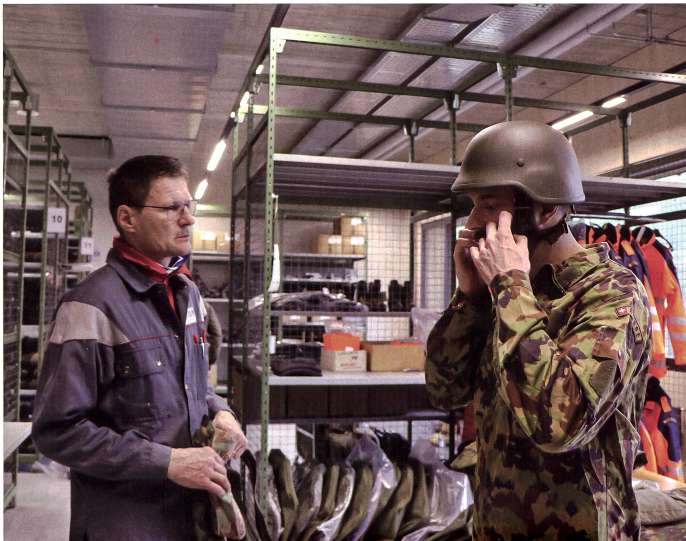
Viele Gegenstände werden gefasst: Mit dem MBAS-Ausrüstungssystem wird die Logistik bald noch komplexer werden.