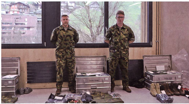
Der SCHWEIZER SOLDAT war bei der Materialfassung des SWISSCOY Kontingent 48 im Februar 2023 dabei.