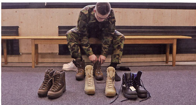
Am Schuhwerk soll es nicht mangeln. Hier auf dem Bild sind die verschiedenen Kampfstiefel zu sehen, die für den Einsatz im Kosovo gefasst werden. Bei den 3. Stiefeln von links handelt es sich um Schuhe mit Stahlkappen für die Geniesoldaten.