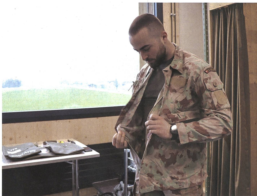
Anprobe des Tarnanzuges für den Sommer. Dieser wird nur für Friedensförderungseinsätze abgegeben.

Der wohl schwerste Gegenstand ist natürlich die Schutzweste inklusive ihrer