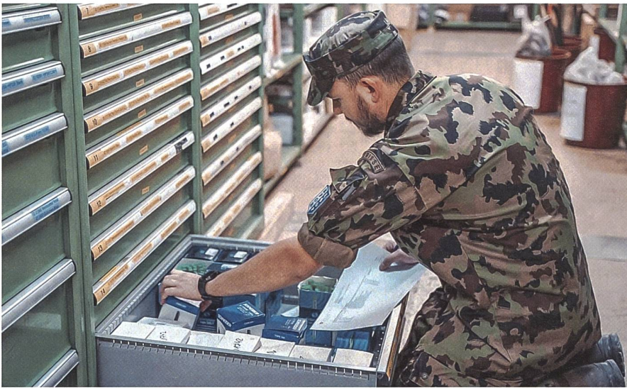
Organisieren und Kontrollieren – das gehört zum Alltag der Nachschubspezialisten.