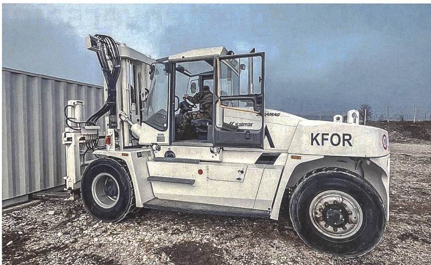
Eines der wichtigsten Fahrzeuge für den Nachschub: der Gabelstapler.