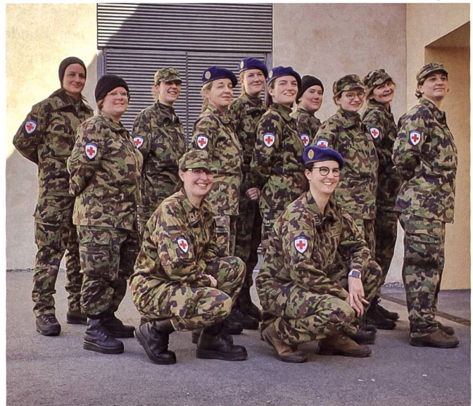
Insgesamt blickt der RKD auf 2829 Diensttage zurück, die von 231 Kameradinnen geleistet wurden.

Das Militär hat 60 Prozent der gesamten chirurgischen Kapazitäten übernommen. Alle Spitäler in der Nähe der Front (bis zu 50 Kilometer) werden von der Armee koordiniert.