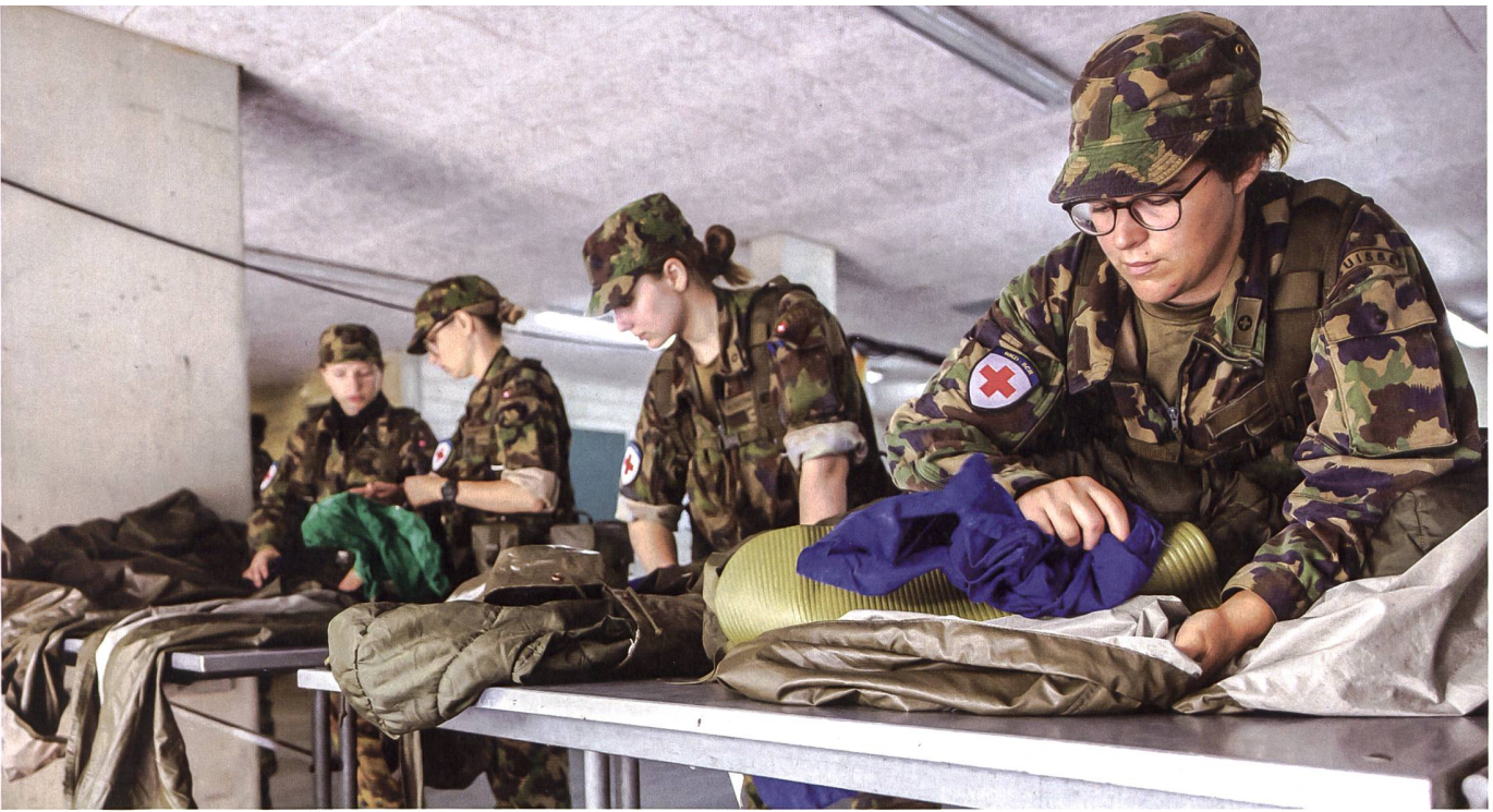
Der RKD will die Rekrutenschule neu organisieren.