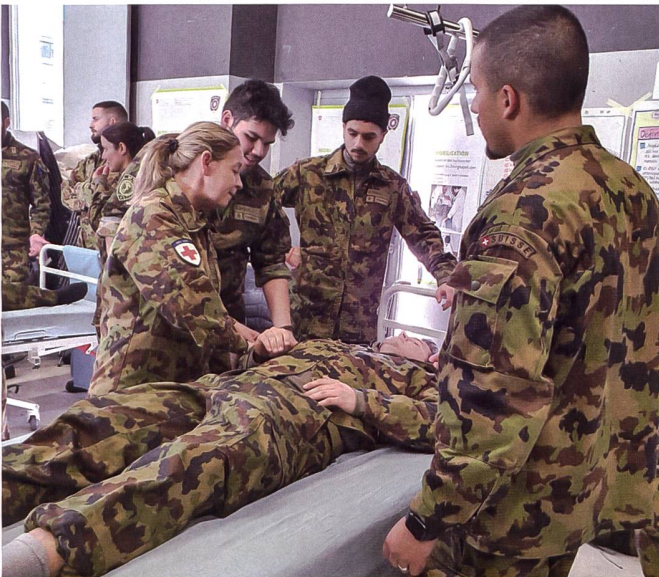
Das Schwergewicht für WK-Einsätze soll zukünftig auf der KVK- sowie WK-Woche 1 liegen.