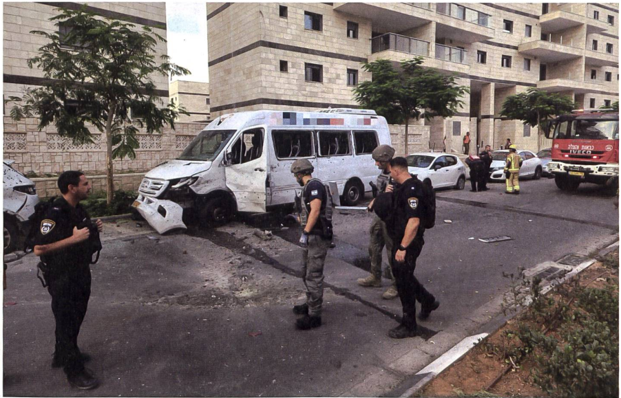
Im Mai 2021 beschoss die Hamas, zum ersten Mal seit 2014, grossflächig israelische Gebiete mit Raketen. Hier im Bild: Einschlagskrater einer Rakete.

Die Palästinenser beanspruchen diese Gebiete für einen unabhängigen Staat Palästina mit dem arabisch geprägten Ostteil Jerusalems als Hauptstadt. Im «Jom-Kippur-Krieg» 1973 versuchten Ägypten und Syrien verlorenes Territorium zurückzuerobern, der Angriff wurde von Israel erfolgreich, jedoch unter grossen Verlusten, auf den Golanhöhen abgewehrt. →