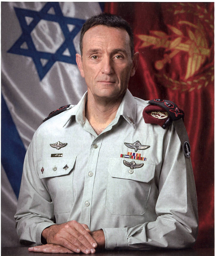
Generalmajor Herzi Halewi übernimmt neu die Funktion des 23. Generalstabschefs der IDF.