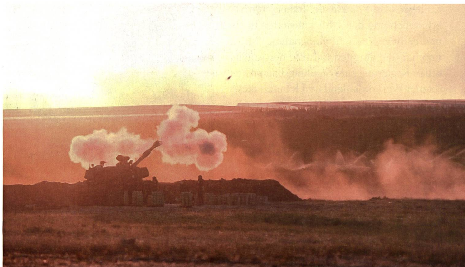
Israelische Artillerie beim Feuerkampf. Reine militärische Überlegenheit bedeutet jedoch in kleinen Kriegen nicht garantierten militärischen und politischen «Erfolg».

Die letzte grosse Eskalation des Nahost-Konflikts in Israel und Gaza ereignete sich im Mai 2021. Nach Raketenangriffen von Irregulären Kräften verschiedener militanter palästinensischer Organisationen, vornehmlich von irregulären Kräften der Hamas, auf israelische Ziele reagierten die Israel Defense Forces mit Luftschlägen auf verschiedene Ziele in Gaza. Nach offiziellen israelischen Angaben feuerten palästinensische irreguläre Kräfte innerhalb