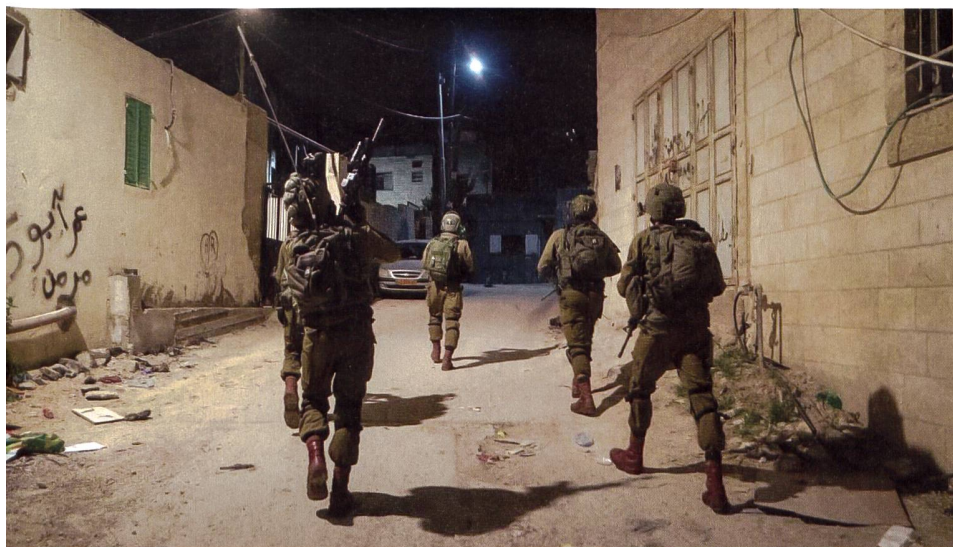
Israelische Milizsoldaten auf Patrouille: Seit Jahrzehnten gilt im Nahost-Konflikt: Falls es in einem Augenblick etwas ruhiger ist, ist dies ziemlich wahrscheinlich die «Ruhe vor dem nächsten Sturm».

rael perfektioniert. In den israelischen Streitkräften wird von der «Metro» bzw. der «U-Bahn» Gazas gesprochen. Diese Tunnel verlaufen sowohl innerhalb des Gazastreifens als auch unter der Grenze zu Ägypten.