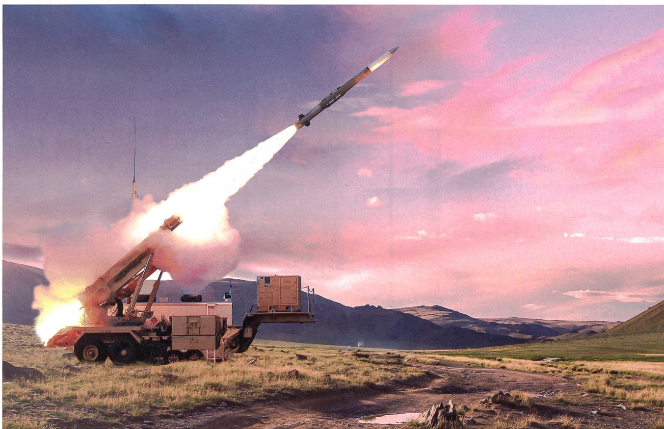
Patriot: Schutz des Luftraums soll gestärkt werden.