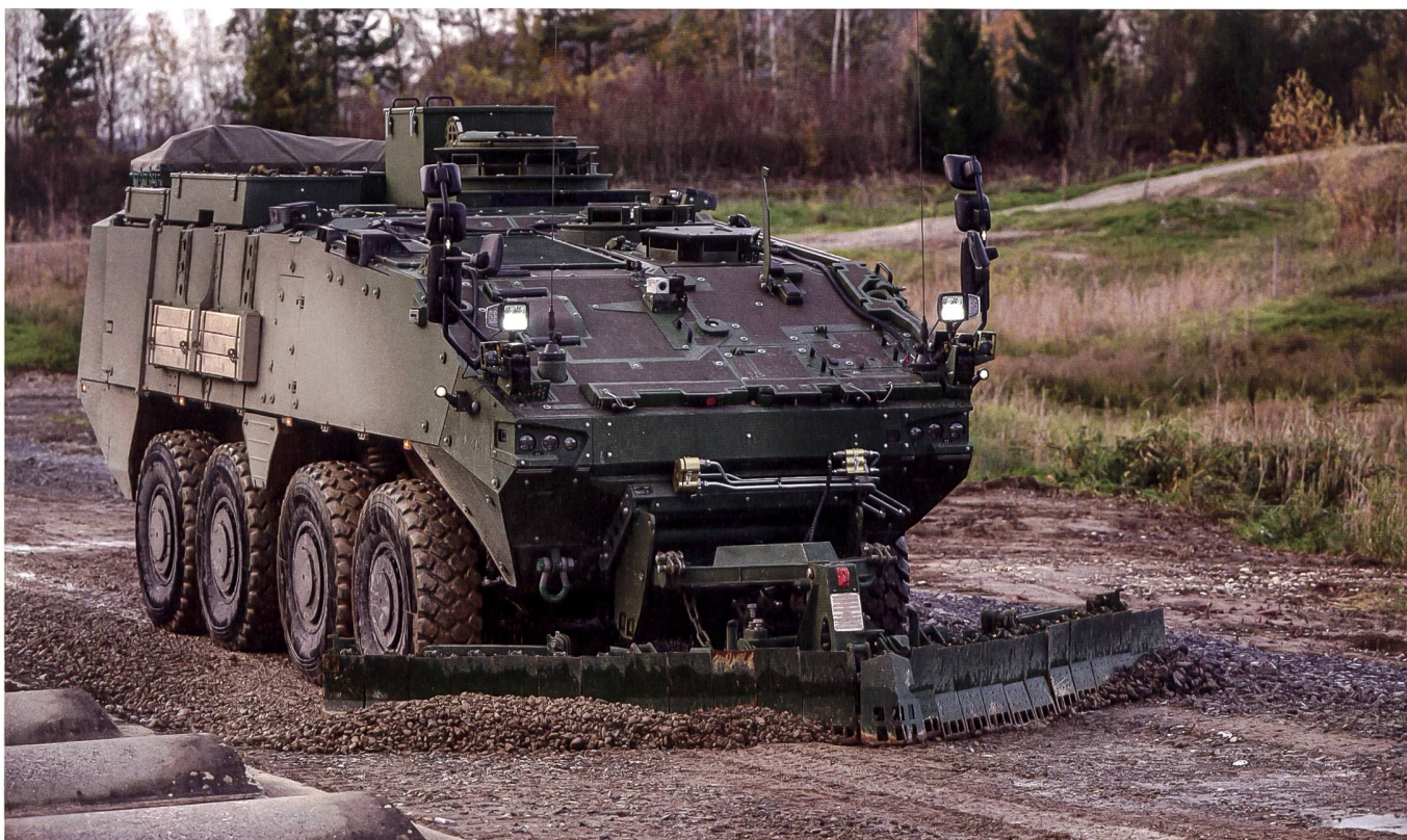
Nicht nur Schutz der eigenen Truppen, sondern auch Genieleistungen können die neuen Radschützenpanzer erbringen. Hier im Bild bei der Räumung von Minen.