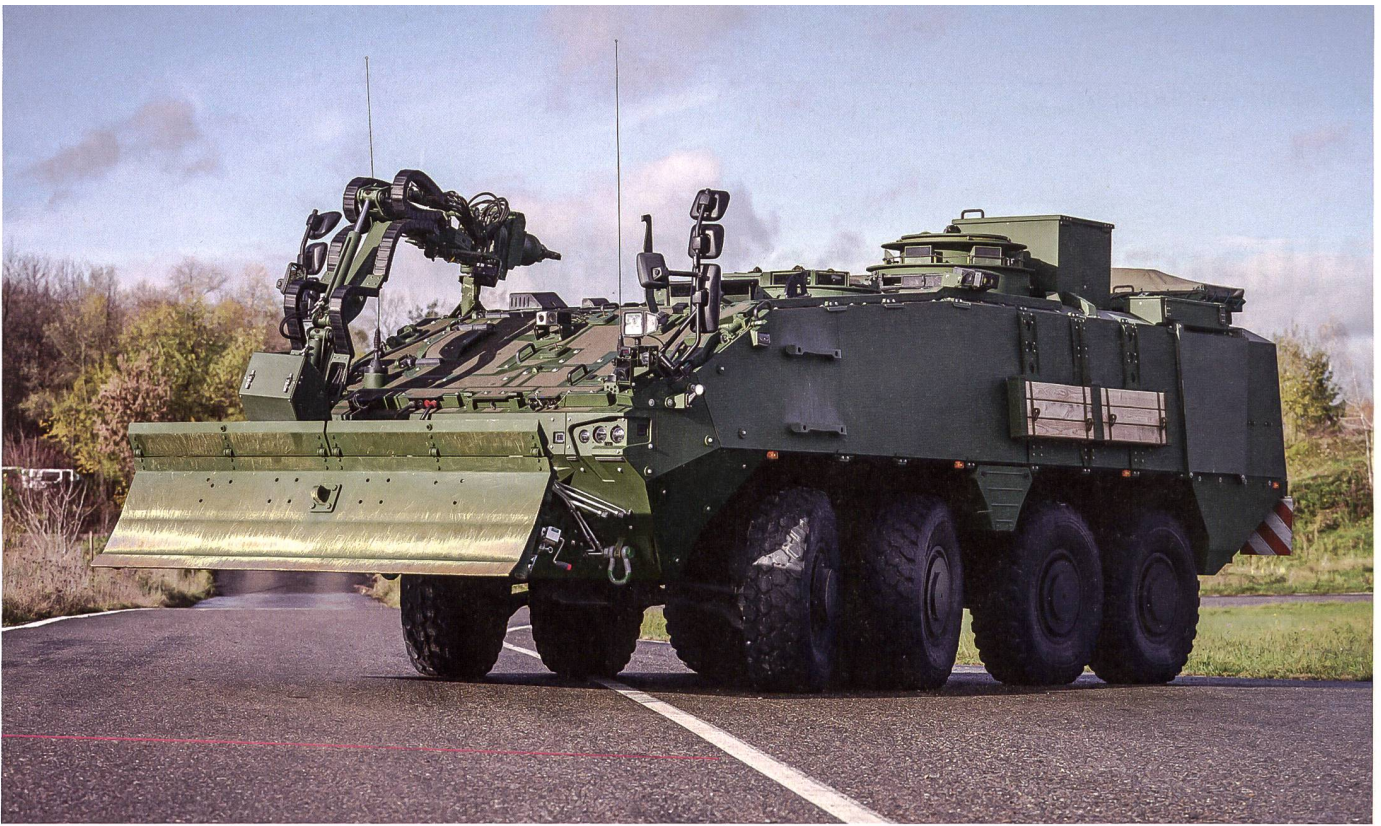
Fahrzeuge für die Panzersappeure. Im Rüstungsprogramm 23 ist von der Vollausrüstung die Rede.