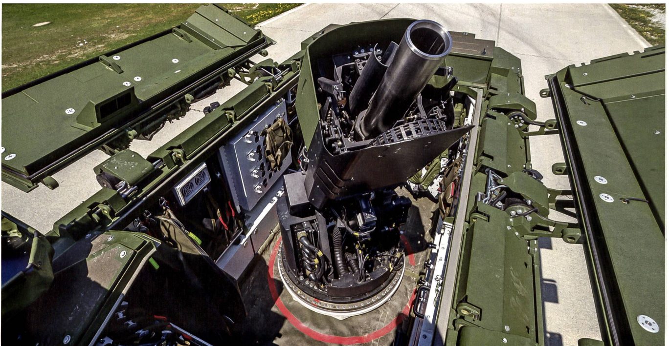
Mörsergranaten: Für den Mörser 16 sollen Mörsergranaten umgebaut werden.