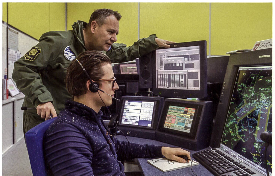
Führungsinfrastruktur: Das Luftraumüberwachungs- und Einsatzleitsystems Florako soll eine neue Konsole erhalten.

Mit dem Rüstungsprogramm 2021 wurden Radschützenpanzer genehmigt. Ihre Anzahl reicht aber nicht aus, um alle sechs Panzersappeur-Kompanien vollständig aus-