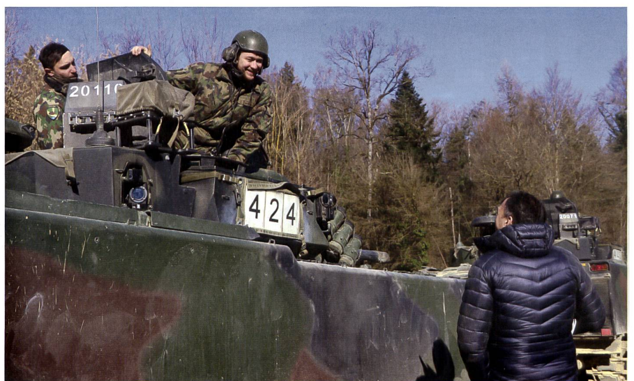
Diejenigen Chefs, welche keine Militärerfahrung haben, lernten die Armee am Arbeitbertag aus erster Hand kennen.