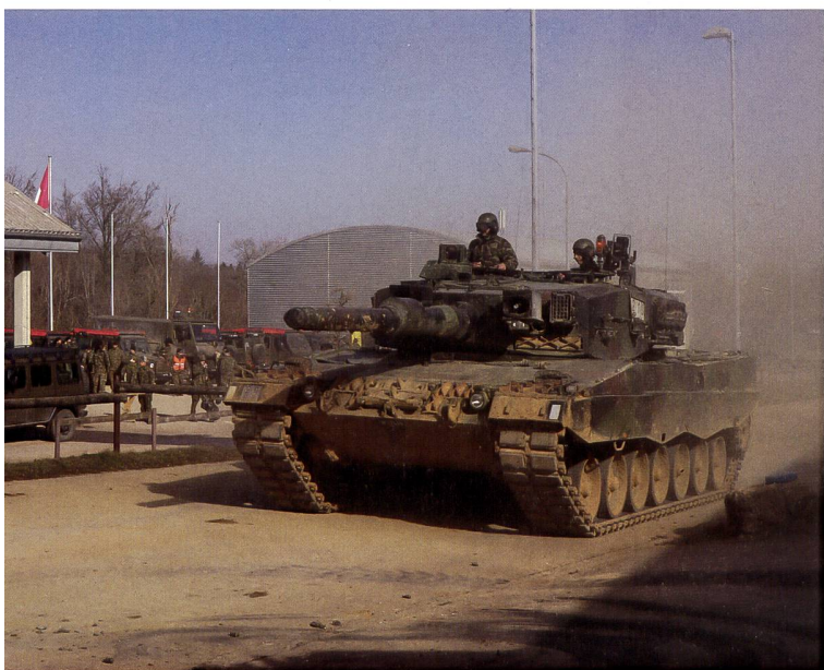
Sich selber ein Bild machen! Die Arbeitgeber der Höheren Kader, wurde nach Bure eingeladen.