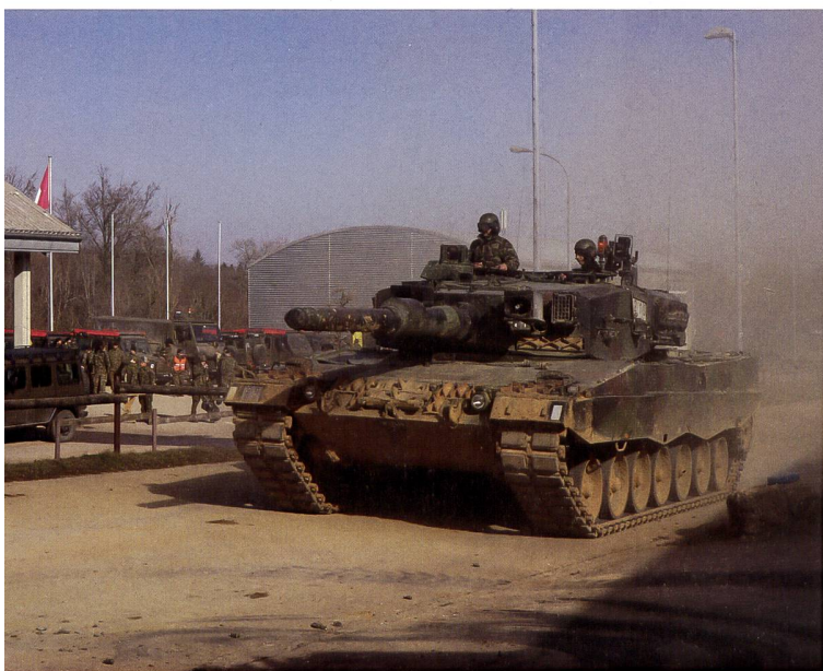
Sich selber ein Bild machen! Die Arbeitgeber der Höheren Kader, wurde nach Bure eingeladen.