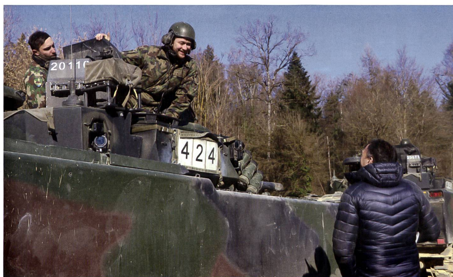
Diejenigen Chefs, welche keine Militärerfahrung haben, lernten die Armee am Arbeitgebertag aus erster Hand kennen.