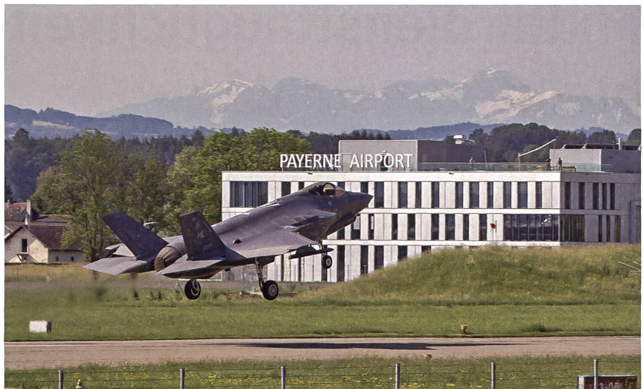
Bei der Beschaffung von neuem Material hat die Schweiz erste wichtige Schritte vollzogen.