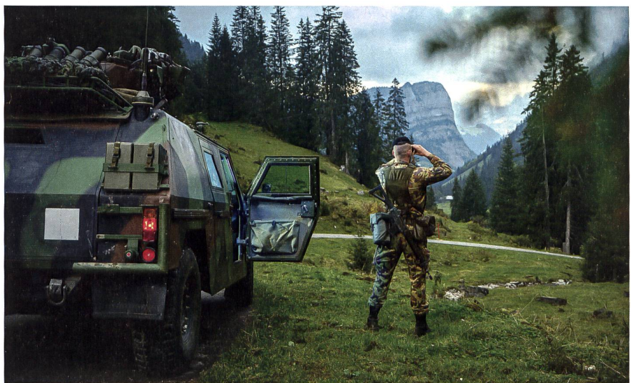
Doch zur Verteidigungsfähigkeit ist weit mehr erforderlich: Die Bodentruppen sind endlich komplett auszurüsten.