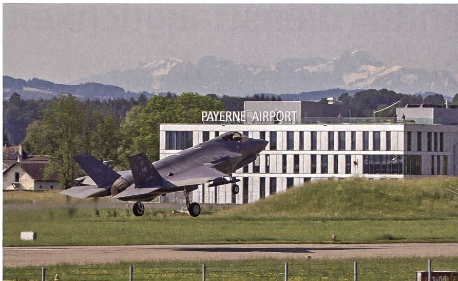
Bei der Beschaffung von neuem Material hat die Schweiz erste wichtige Schritte vollzogen.