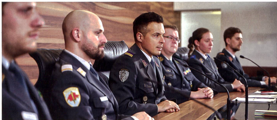
Neben dem Gerichtspräsidenten, der in der Militärjustiz eingeteilt ist, leisten Richter der Militärjustiz Dienst in ihren jeweiligen Formationen. Dies in allen Graden und allen Truppengattungen.

Am 31. Dezember 2017 endete seine Militärdienstpflicht in der Schweiz. Im Zusammenhang mit seiner Bewerbung beim Armee-Aufklärungsdétachement 10 erstattete X. am 24. Oktober 2018 Selbstanzeige, womit das vorliegende Strafverfahren ausgelöst wurde. (Anmerkung der Redaktion: Wenn Sie mehr über den Ausgang obigen Falles lesen möchten, rufen Sie bitte die Webseiten der Militärjustiz auf unter www.oa.admin.ch )