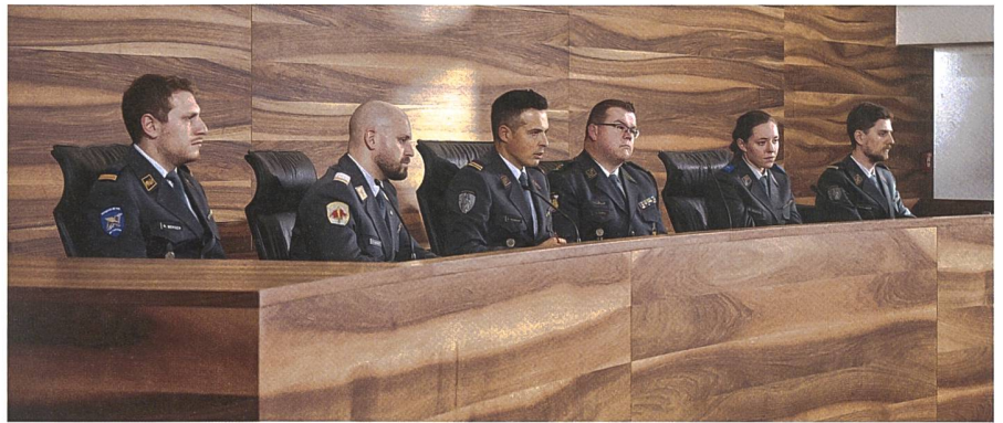
Die Hauptverhandlungen vor den Militärgerichten sind öffentlich.

Der Untersuchungsrichter schliesst die Voruntersuchung in der Regel mit einer Schlussverfügung ab. Der Auditor entscheidet über den Fortgang des Verfahrens. Er hat drei Möglichkeiten: Anklageerhebung, Einstellung des Verfahrens (mit oder ohne disziplinarische Bestrafung) oder Erlass eines Strafmandats. Zudem können der Auditor, der Beschuldigte sowie der Geschädigte Ergänzung der Voruntersuchung durch den Untersuchungsrichter verlangen.