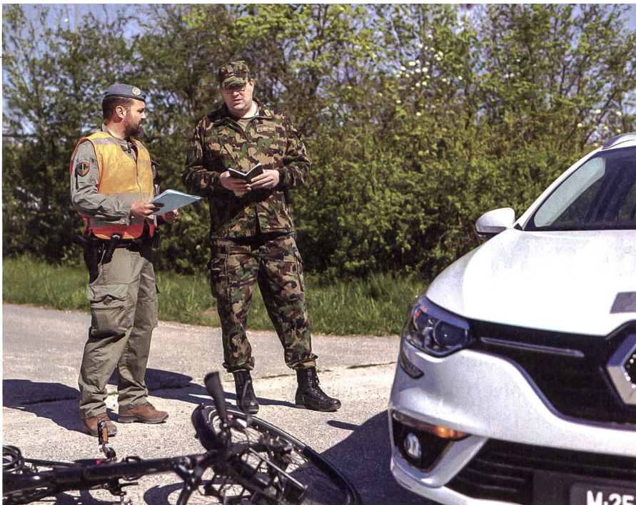
Mehrfach wollten Armeegeegner bisher die Militärjustiz abschaffen. Bereits 1916 wurden erste Versuche unternommen.

Denn dank des militärischen Know-hows der Militärgerichte, in denen alle Grade und auch Nicht-Juristen vertreten sind, können die Verfahren effizient und überzeugend abgehandelt sowie in aller