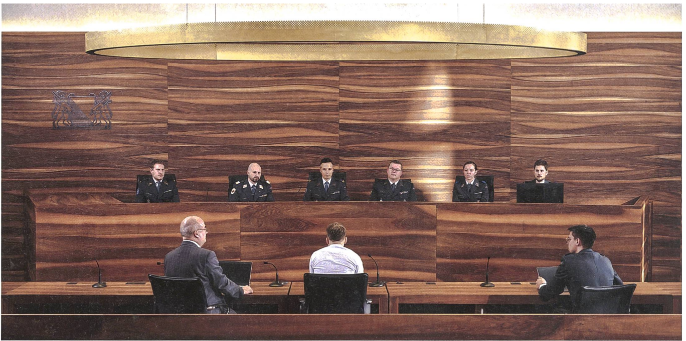
Die Militärjustiz ist die militärische Strafverfolgungs- und Gerichtsbehörde der Schweiz. Sie beurteilt die der Militärstrafgerichtsbarkeit unterworfenen strafbaren Handlungen gemäss dem Militärstrafgesetz