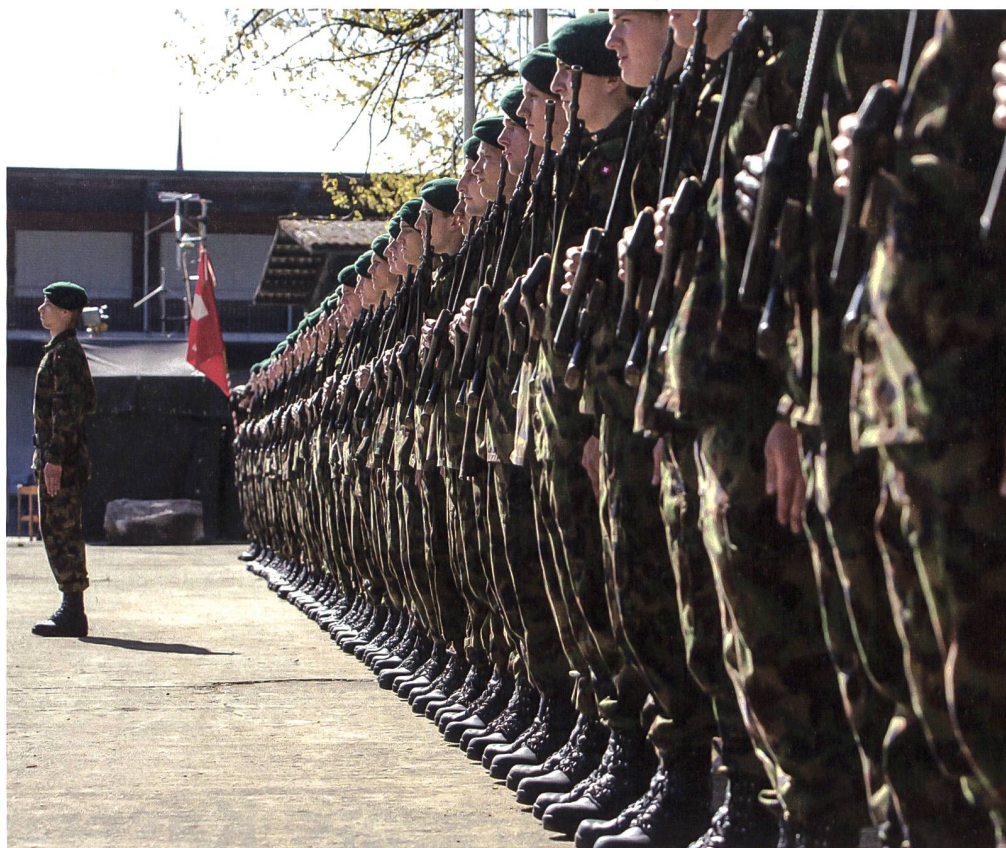
Sowie an Personal.