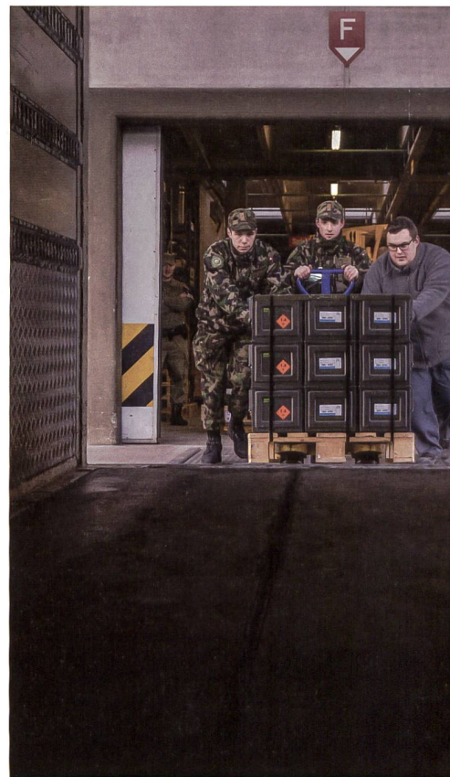
Es mangelt an Munition.