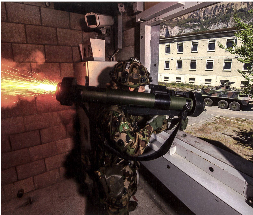
Heute ist die Armee nicht mehr in der Lage, das Land zu verteidigen.