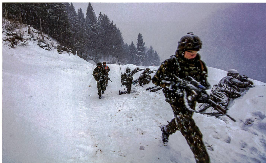
Kontra: Diese Unterstützung verbraucht Ausbildungsdiensttage und diese sind vor allem in der Infanterie Mangelware geworden (Symbolbild).

Denn sie verbraucht wertvolle Diensttage. Dies führt zu Problemen in den WKs