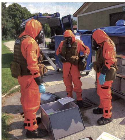
Das Labor Spiez beschäftigt aktuell 110 Mitarbeiterinnen und Mitarbeiter, von denen mehr als ein Drittel über einen Universitäts- oder Fachhochschulabschluss, zur Hauptsache in Natur- oder Ingenieurwissenschaften, verfügen.