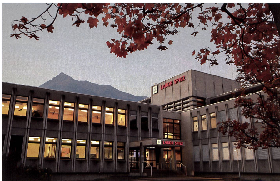
Im Einsatz für eine Welt ohne Massenvernichtungswaffen: Das Labor Spiez.

Die Konfrontation zwischen den Supermächten sowie die zahlreichen Atombombentests führten 1954 zur Gründung des Schweizerischen Bundes für Zivilschutz. Im Sinne einer Konzentration der Kräfte übertrugen die zuständigen Behörden die Prüfungen für Schutzmaterial und Schutzgeräte dem Laboratorium