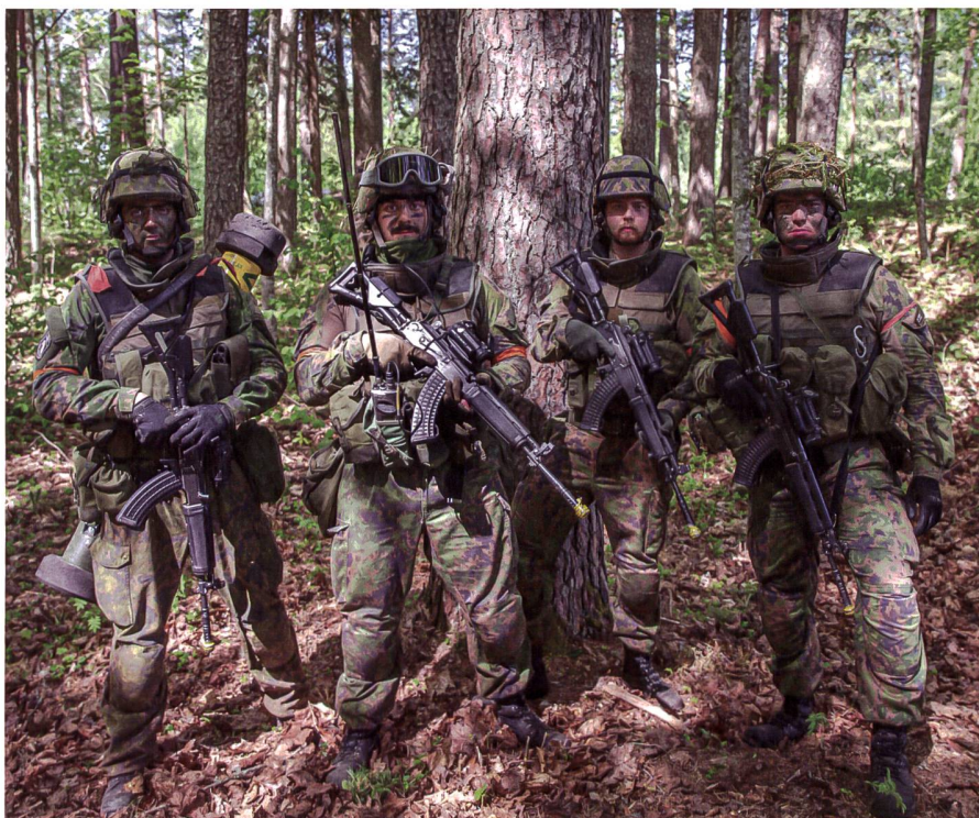
Was macht eine gute Kompanie aus? Die finnischen Streitkräfte haben in ihrem GrundschoL-Reglement einige wichtige Aspekte zusammengefasst.

Etwa so ähnlich wie das Schweizer Reglement GrundschoLung erfüllt auch das finnische «Soldatenhandbuch» seinen Zweck. Dort lernen Soldaten nicht nur den Umgang mit ihrer Waffe und den militärischen Alltag, sondern auch Werte und Leadership-Aspekte.