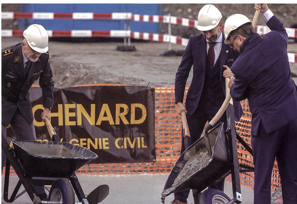
Die Kosten des Baus sind auf 33,5 Millionen Franken veranschlagt. Daran beteiligen sich der Kanton Wallis mit 11 Millionen Franken und der Bund mit 22,5 Millionen Franken.