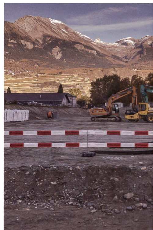
Spätestens im Herbst 2024 soll die Trainings-

anlage weil sich der Schiessplatz Pra Bardy in der Nähe einer Wohngegend und zweier Campingplätze befindet.