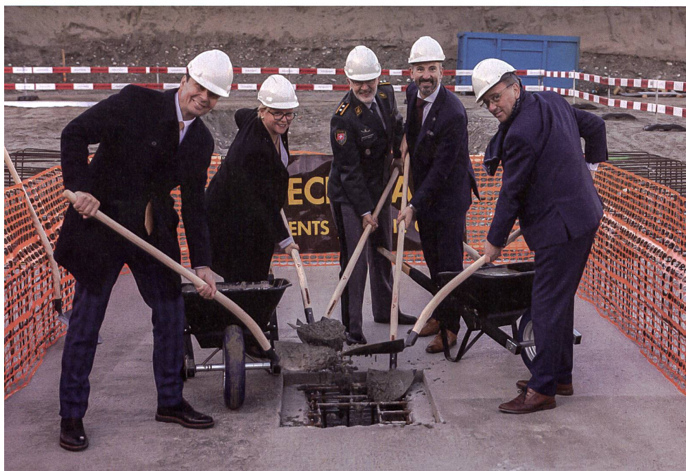
An der offiziellen Zeremonie zum Baubeginn der Indoor-Schiessanlage auf dem Areal der Militärkaserne in Sitten haben Vertreter der Schweizer Armee, des Kantons Wallis und der Stadt Sitten teilgenommen.