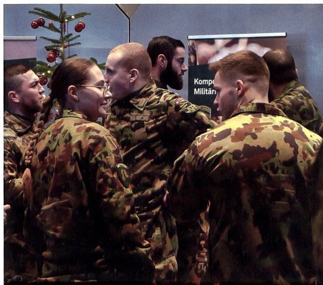
Mit dem Format «Infanterie-Messe» bot der Jahresrapport auch genug Zeit, um sich auszutauschen.