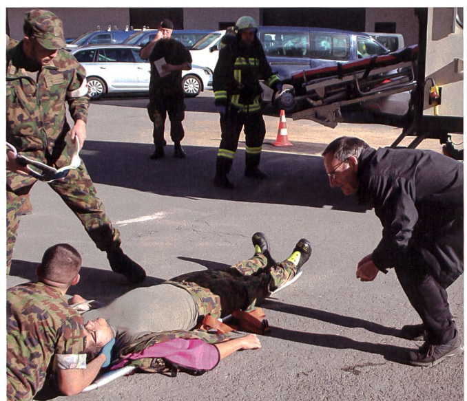
Zum Glück nur simuliert verletzt: die Sanitäter im Einsatz.