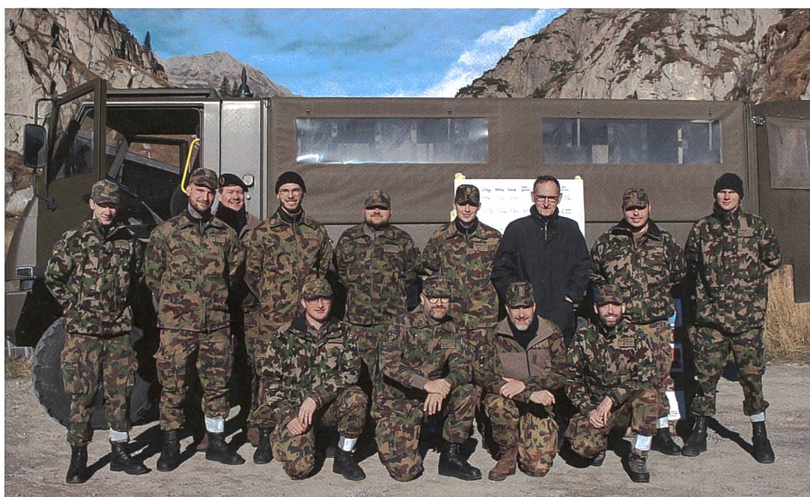
Zu Besuch bei der HQ-Transportkompanie 11/3.

rungsrat Mario Fehr Zeit, um sich mit den Soldatinnen und Soldaten, aber auch mit dem Kader vor Ort zu unterhalten und sich über das Wohl der Menschen zu erkundigen.