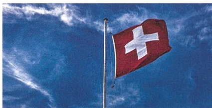
Die Auslegung der Schweizer Neutralität sorgt für immer mehr Diskussionen.

Landes. Dieses Festhalten an der Neutralität wird im Ausland zunehmend nicht mehr verstanden. Insbesondere in einem