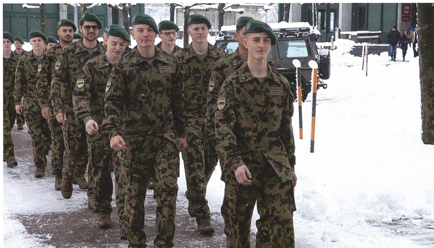
Stolze frisch beförderte Wachtmeister der Inf DD UOS 14-1.