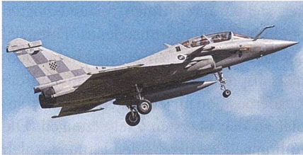
Start des Flugtrainings mit den kroatischen Rafale-Kampfflugzeugen.

Mitte September hat der erste von zwölf Rafale Kampffjets für Kroatien im französischen Saint-Dizier mit Trainingsflügen begonnen. Beim ersten Rafale für Kroatien handelt es sich um einen Doppelsitzer Rafale B. Kroatien hat nach langem Hin