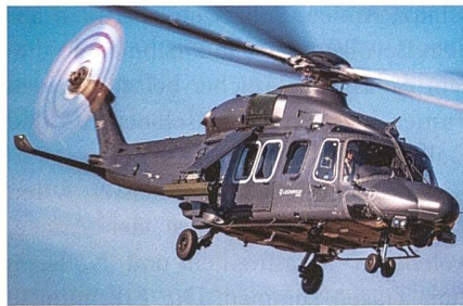
Mehrzweckhubschrauber AW149 an die polnische Streitkräfte übergeben.

Die polnischen Landstreitkräfte haben Ende Oktober ihre ersten beiden von insgesamt 32 bestellten AW149-Hubschrauber des italienischen Herstellers Leonardo in Dienst gestellt; dies nur 15 Monate nach Vertragsunterzeichnung. Der AW149 ist ein etwas grösseres Modell als der in Italien und beim österreichischen Bundesheer in Einführung befindliche AW169. An den nun an die polnischen Streitkräfte ausge-