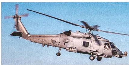
Verkaufserfolg für die Sikorsky MH-60R Seahawk in Norwegen und Spanien.

Die US Navy beauftragte Lockheed Martin mit der Herstellung von sechs Mehrzweckhubschraubern des Typs MH-60R