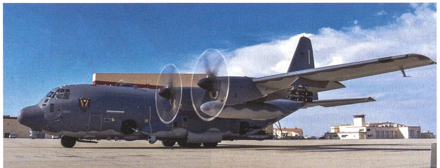
Versuche mit dem Airborne High Energy Laser auf einer AC-130J beginnen.