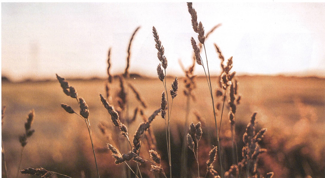
Ungefähr 10 bis 15 Prozent des weltweit gehandelten Weizens, der Gerste und des Maises stammen aus der Ukraine.