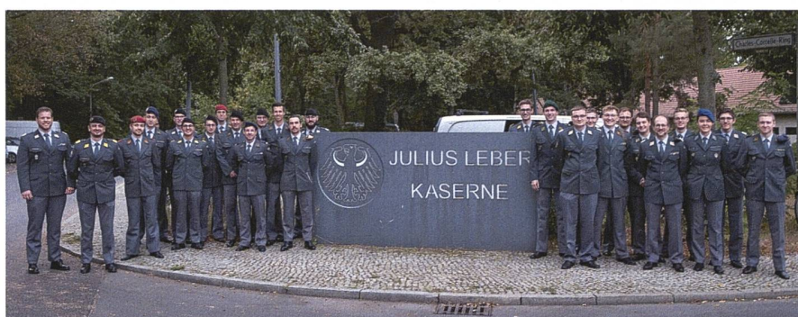
Ein Rekord: 28 Mitglieder waren bei der diesjährigen «U STORIA» dabei.