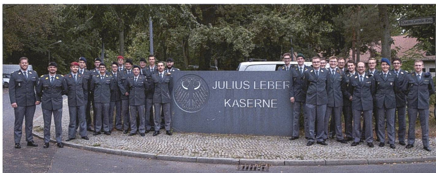
Ein Rekord: 28 Mitglieder waren bei der diesjährigen «U STORIA» dabei.