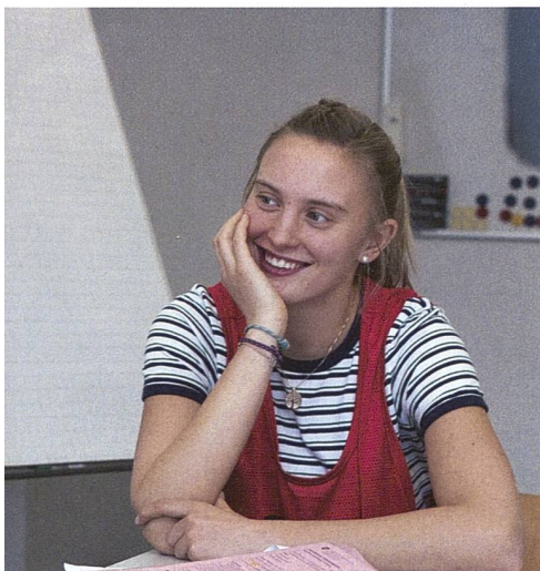
em Gesamtbild einer Person, in das viele