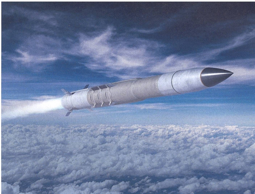
Die Schweiz beschafft 72 der PAC-3 MSE-Rakete von Lockheed Martin.

Am 5. November erhielt die Schweiz die Genehmigung vom US-Aussenministerium (DSCA), um 72 dieser von Lockheed Martin hergestellten Patriot Advanced Capability-3 MSE-Raketen (Missile Segment Enhancement) zu kaufen. Die Vereinbarung umfasst nicht nur die PAC-3-Raketen selbst, sondern auch die dazu gehörige Werfertechnologie sowie logistische und technische Unterstützung.