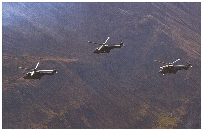
Super Puma / Cougar.