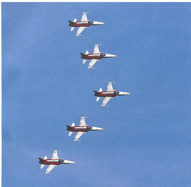
Die Patrouille Suisse zeigte den Gästen ihre Fliegerfähigkeiten.