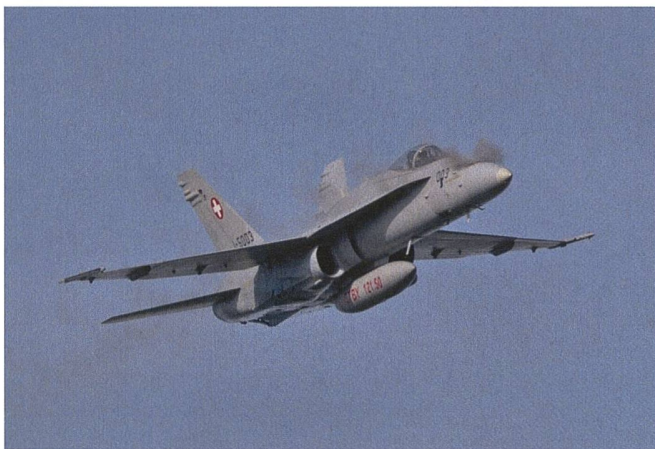
F/A-18 Hornet beim Schiesstraining.