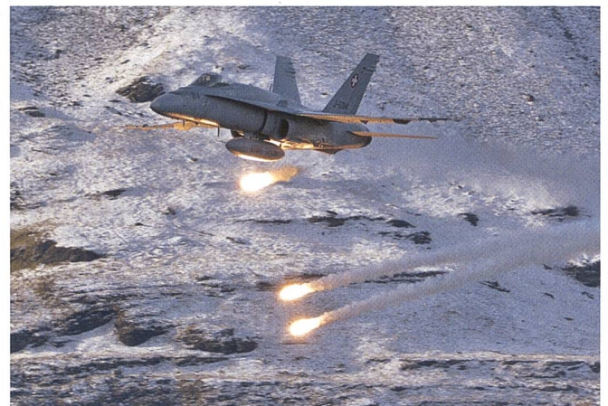
Die F/A-18 ist seit 1997 im Einsatz.