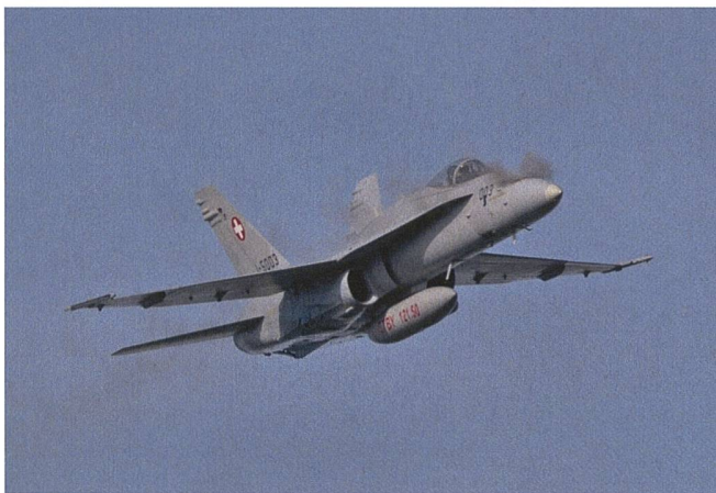
F/A-18 Hornet beim Schiesstraining.

Die Armee erwartete an beiden Tagen, dieses Jahr am 18. und 19. Oktober 2023, je 4500 Besucherinnen und Besucher. Aufgrund des schlechten Wetters musste der Trainingstag am Donnerstag jedoch abgesagt werden. Im nächsten Jahr wird das Fliegerschiessen auf der Axalp ausfallen, da die Luftwaffe ihr Können beim Event «Airspirit24» vom 30. bis 31. August 2024 auf dem Militärflugplatz in Emmen demonstrieren wird, zu dem bis zu 35 000 Besucher erwartet werden. +