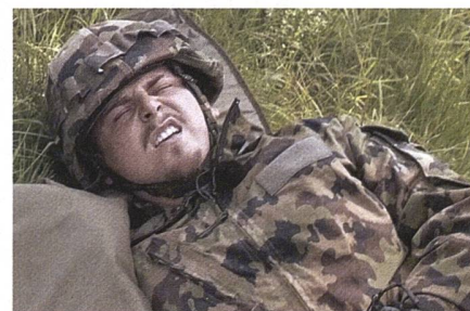
Die Drillpiste hatte es in sich. Der Rapper musste sie frühzeitig abbrechen.