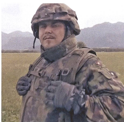
Rapper EAZ tauschte für einen Tag sein Bühnenoutfit mit dem TAZ.

Das Manövrieren des grossen Fahrzeuges verlief nicht sonderlich nach Plan, zumal der frischgebackene Rekrut im Jahr 2014 seinen Führerschein abgeben musste. Diese Aufgabe hat er nicht geschafft,