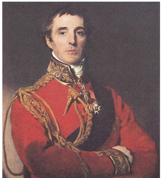
Arthur Wellesley (später Duke of Wellington; 1760-1852) setzte auf flexible Linien.