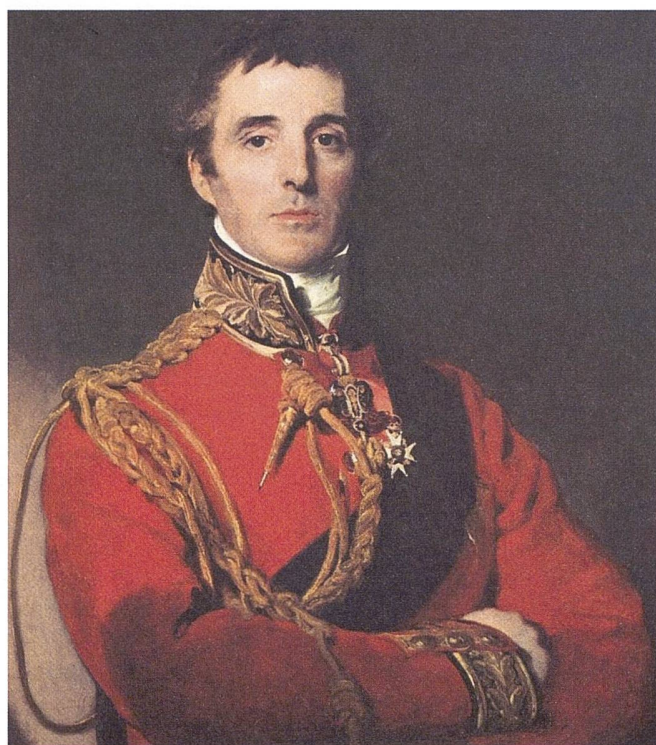
Arthur Wellesley (später Duke of Wellington; 1760-1852) setzte auf flexible Linien.