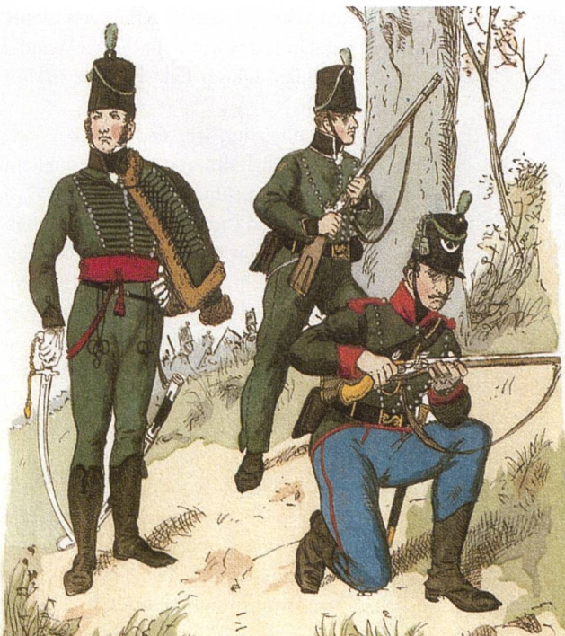
V.l.n.r.: Offizier des britischen 95th Rifle Regiment, Soldat des 95th Rifle Regiment und Soldat des britisch-kanadischen 60th Rifle Regiment.

Bild: Richard Knotel, Uniformenkunde, Lose Blätter zur Geschichte der Entwicklung der militärischen Tracht, Berlin, 1890.